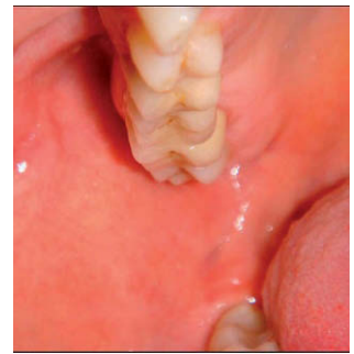
Figura 2 - Imagen intraoral preoperatoria.