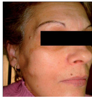
Figura 1 - Imagen preoperatoria.

Se realiza tomografía computarizada (TC) cérvico-facial, en la que se aprecia simetría de las glándulas parótidas con una morfología normal y una mayor captación de contraste en el lado derecho (figs. 3 y 4). Se objetiva una dilatación del conducto de Stenon derecho de 1 cm en su máximo diámetro y un acodamiento en su porción distal. No es posible discernir la presencia de cálculos o estenosis en su porción final debido a artefactos radiológicos. No obstante, en una TC realizada un año antes en otro centro hospitalario se describe una imagen compatible con sialolitiasis en el tercio distal del conducto.