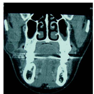
Figura 4 - Tomografía computarizada coronal preoperatoria.