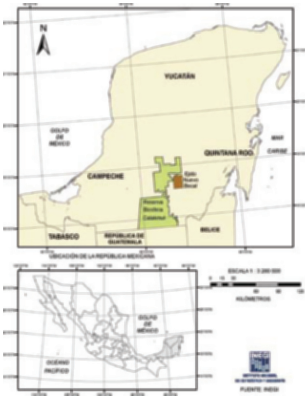
Figura 1. Ubicación de la RBC y el ejido Nuevo Becal en el estado de Campeche, México.

La Reserva de la Biosfera de Calakmul fue establecida en 1989, tiene una extensión de 7 231.25 km 2 en su totalidad con aproximadamente 4 000 km 2 al sur de la carretera Escárcega-Chetumal (Morales y Magaña, 2001). El ejido Nuevo Becal (ENB) se ubica en las coordenadas 18°40'07.7" N, 89°12'34.3" O, adyacente a la RBC (Fig. 1). El ejido tiene una extensión de 520 km 2 , de los cuales la mitad está destinada como área forestal permanente, donde sólo se permite el aprovechamiento forestal y la cacería. En general, se estima que más de 80% del ejido presenta cobertura forestal.