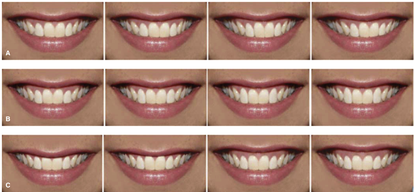
Figura 2. A) Modificaciones para «línea media». B) Modificaciones para «margen gingival». C) Modificaciones para «exposición gingival».