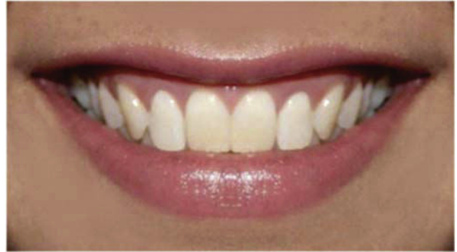
Figura 1. Fotografía de la sonrisa con parámetros estéticos de normalidad.

Línea media: se diseñaron cuatro imágenes con desviación de la línea media dental, de 1 a 4 mm hacia la derecha.