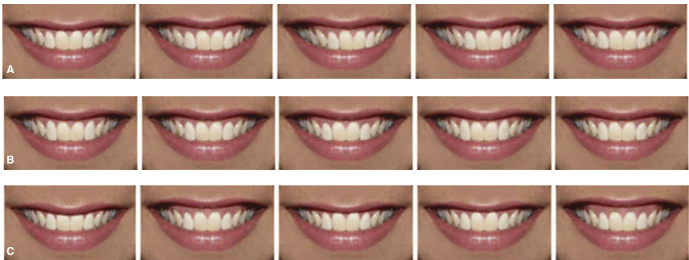
Figura 3. Modificaciones para cada parámetro, colocadas en orden aleatorio. A) Línea media. B) Margen gingival. C) Exposición gingival.