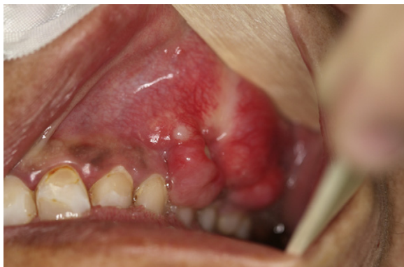
Figura 1 – Imagen clínica. Lesión excrecente en maxilar superior, de morfología irregular, consistencia dura, sin ulceración y adherida a planos profundos.

Mujer de 27 años de edad con antecedentes personales de neurofibromatosis tipo I que acudió a nuestras consultas por presentar una tumoración sólida, de consistencia dura, en región maxilar izquierda de unos 2 meses de evolución. No