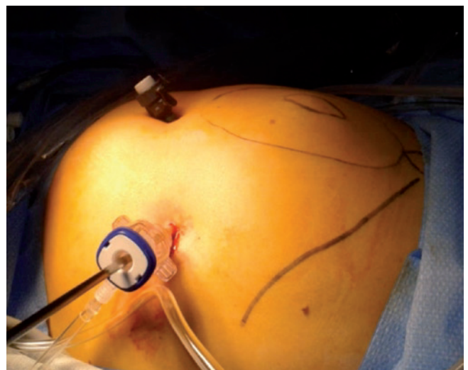
Figura 4 – Abordaje parietal con dos puertas de 3 y 5 mm.