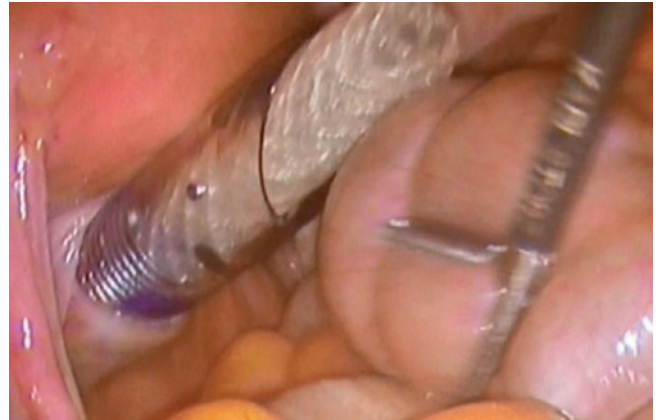
Figura 3 – Entrada de la prótesis por el canal vaginal protegido con trocar enfundado.