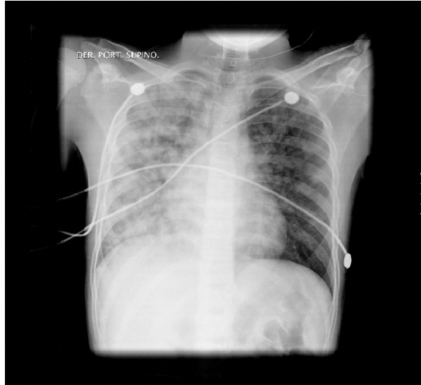
Figura 1. Radiografía de tórax (17/12/2009) tomada seis horas después de haber aterizado en Bogotá después de un viaje a Londres. Se observan infiltrados bilaterales en "copos de algodón" de predominio derecho, producidos por el edema pulmonar de las alturas.

y hasta un día después de realizar este tipo de viajes. El paciente logró mejoría parcial de los síntomas sin tener que consultar nuevamente a urgencias; sin embargo, la seriedad de los episodios afecta su calidad de vida. Está asintomático mientras no viaje. Durante la valoración por consulta externa, el paciente se encuentra asintomático y con un examen físico normal (último viaje dos meses antes de esta consulta).