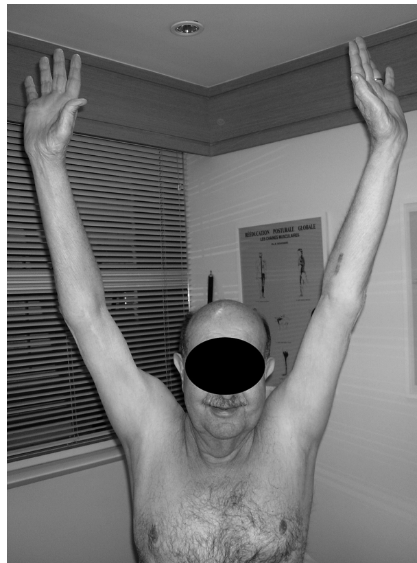
Figura 4 – Imagem clínica de um paciente após a reabilitação funcional.

após o programa de reabilitação, com um segmento mínimo de nove meses. Entretanto, a força muscular não melhorou.