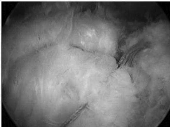
Figura 2 – Imagem cirúrgica artroscópica, visão subacromial, que mostra completo fechamento de uma lesão extensa do manguito rotador.

bons, dois (5%) regulares e cinco (13%) ruins. Dos cinco casos considerados ruins, apenas um precisou ser reoperado.