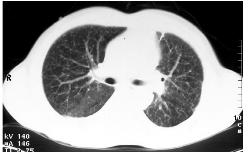
Fig. 2 – Padrão micronodular disperso por ambos os campos pulmonares

brônquicas, mais acentuados à esquerda, com secreções mucopurulentas escassas. Na toracocentese houve drenagem de líquido pleural (LP) de cor amarelo-palha, com características de exsudato (proteínas LP – 4,9 g/dl, LDH LP – 999 U/L, proteínas LP/soro – 0,7, LDH LP/soro – 2,7).