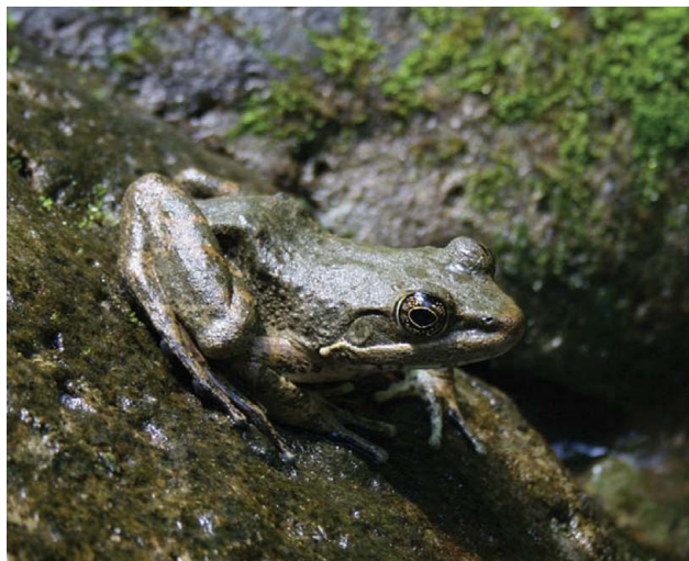
Figura 1. Ejemplar de Lithobates johni localizado en la Reserva Ecológica Pancho Poza, Altotonga, Veracruz, México.

Se registraron 9 individuos adultos, de los cuales se recolectaron 2 para ser depositados en la colección del Instituto de Investigaciones Biológicas de la Universidad Veracruzana, bajo las etiquetas CIB303 y CIB304 (Fig. 1). Los individuos se encontraban en el interior del río, posados sobre rocas, en áreas someras con poca