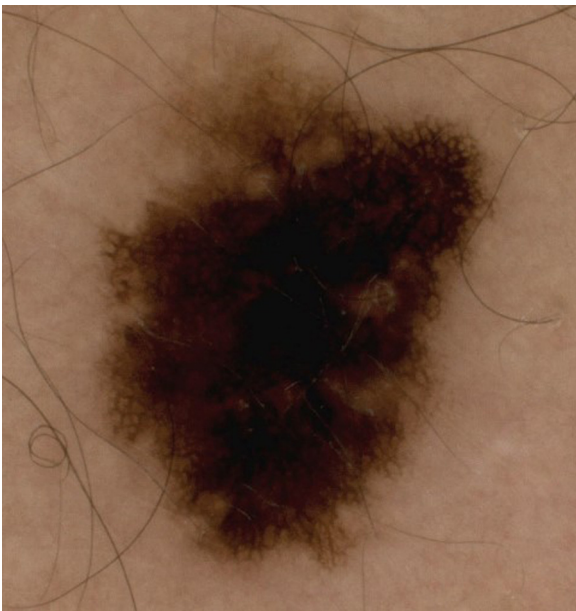
Figura 5 Red de pigmento atípica y asimetría en 2 ejes en un melanoma invasivo menor de 1 mm de espesor.

La extirpación de toda lesión pigmentada aun en sujetos con riesgo por sus características físicas (evidencia de fotodaño, fenotipo I-II, piel tipos 1 a 3) en función únicamente de la evaluación clínica lleva a una tasa elevada de falsos positivos y a procedimientos quirúrgicos y estrés innecesarios 5,6 .