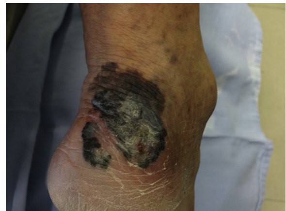
Figura 1 Melanoma invasivo, grueso y ulcerado, clasificado como pT4B; la evidencia clínica es suficiente para el diagnóstico.

En México, la mayoría de los melanomas cutáneos históricamente han sido diagnosticados en etapas localmente avanzadas 2,3 , con datos no solo dermatoscópicos sino clínicos macroscópicos evidentes de la neoplasia como ulceración, sangrado y fase de crecimiento vertical (fig. 1); en estos pacientes la dermatoscopia no ofrece más datos para el diagnóstico de melanoma cutáneo; sin embargo, en aquellos pacientes que se presentan con lesiones incipientes, si bien son la minoría, la decisión de escindirla o no depende de