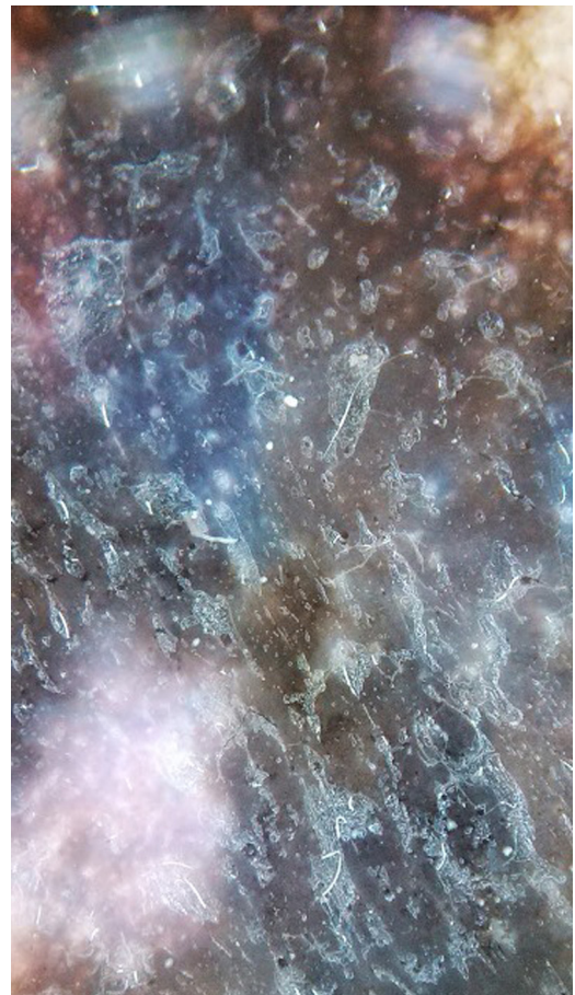
Figura 4 El velo azul tenue de esta lesión además de la presencia de más de 3 colores y área de falta de pigmento corresponden a un melanoma invasivo mayor de 1 mm de espesor.

le compara con la evaluación clínica «al ojo desnudo» 1 ; permite identificar hallazgos microscópicos que pasarían desapercibidos en el análisis clínico y también lesiones no solo con alta sospecha de melanoma sino con un nivel de invasión mayor a una lesión superficial lo cual permite al clínico decidir el tratamiento expedito de este tipo de lesiones.