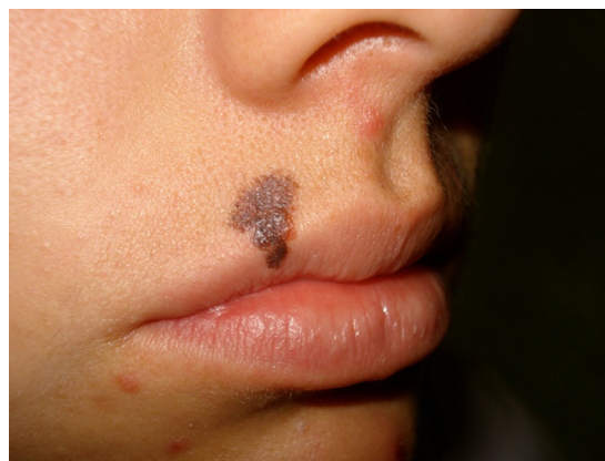
Figura 2 Lesión pigmentada que clínicamente hace dudar si se trata o no de un melanoma; correspondió a un melanoma in situ .

Los hallazgos dermatoscópicos analizados fueron: asimetría en 2 ejes, asociación de colores, áreas con falta de pigmento, puntos irregulares y atípicos de pigmento, red de pigmento atípica, pseudópodos, presencia de velo azul, ulceración y eritema periférico (anillo rosa).