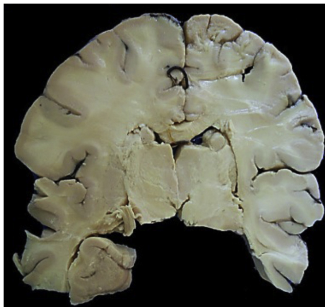
Figura 3 Corte coronal de cerebro donde se observa el edema acentuado y la palidez generalizada.

en la pared de los vasos y necrosis de la corteza cerebelosa (fig. 3). La hipófisis también mostró necrosis extensa (fig. 4).