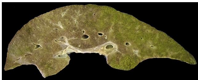
Figura 1 Aspecto macroscópico del hígado que muestra colestasis y zonas extensas de necrosis.