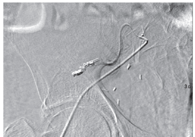
Figuras 1 y 2 – Arteriografía del injerto renal con extravasado de contraste en rama distal. Embolización selectiva de rama distal de arteria del injerto con desaparición del extravasado.