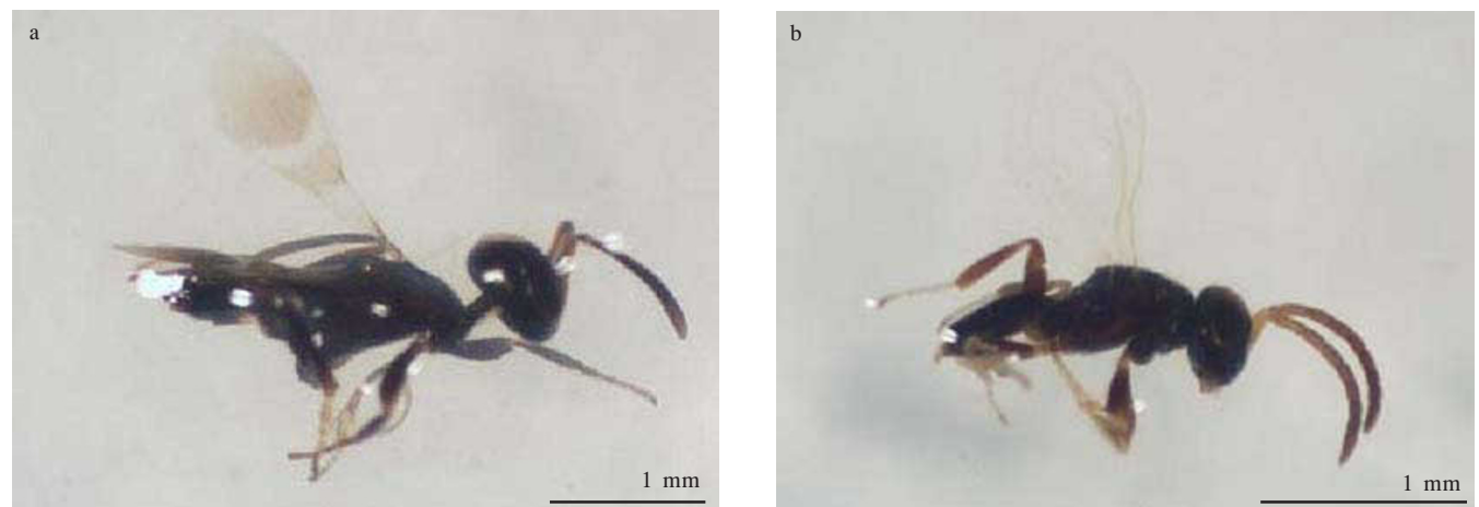
Gambar 2. Imago A. dasyni . a. betina dan b. jantan.