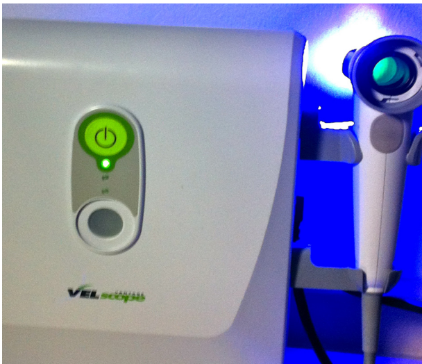
Figura 1 VELscope® emite luz fluorescente con la que se ilumina la cavidad oral; al verse a través de un filtro se pueden identificar lesiones en la mucosa oral que no se perciben con la exploración oral convencional con luz blanca.

los márgenes de sección al identificar cambios en la mucosa que la luz blanca no permite.