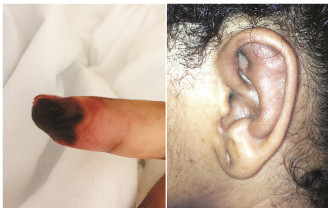
Figura 1 – À esquerda, lesão vasculítica no 2º quirodactilo da mão direita. À direita, edema em pavilhão auricular poupando lóbulo.