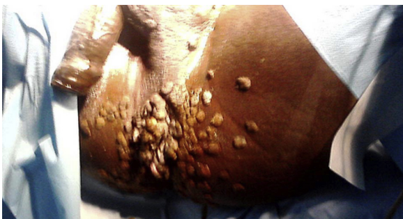
Figure 2 TBL de siège Ano-périnéo-pénoscrotal.