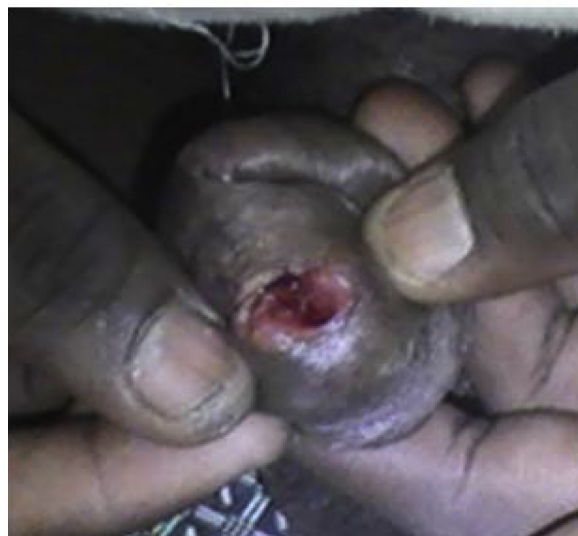
Figure 3 TBL siégeant à la fossette naviculaire et s'émançant au méat urétral aspect avant et après la cautérisation.

Le délai d'ablation de la sonde variait selon le sexe et le siège de la TBL: 7 jours pour les lésions urétrales chez l'homme, de 15 et 18 jours pour les lésions vulvaires chez les femmes. La guérison était effective chez tous les patients avec un recul 2 ans. Un cas de récurrence avait été noté à 6 mois et traité avec succès. Les femmes gestantes avaient accouché par voie basse, deux mois après leur traitement, sans risque de contamination de leur fœtus avec un recul d'un an de suivi. Les rapports sexuels étaient de nouveau possibles sans urétrorragie.