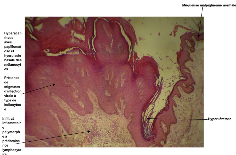
Figure 4 Condylomatose acuminés anopérinéoscrotal et pénien.

matériels souillés [7]. Le virus est résistant aux conditions environnementales. La grossesse est un facteur favorisant l'apparition et le développement de la TBL. Durant la grossesse, la TBL est 3 fois plus fréquente [7]. Deux des TBL observées dans notre étude concernaient des femmes gestantes au troisième trimestre de leur grossesse. Les modifications de l'immunité cellulaire et l'augmentation des récepteurs d'œstrogènes sont autant de facteurs favorisant [7,8]. Les condylomes de la grossesse régressent le plus souvent et disparaissent après accouchement et n'aggravent pas les lésions dysplasiques même sévères [7,9].