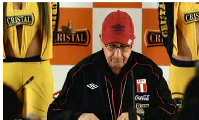
Figura 1 Sergio Markarián anuncia la lista de convocados de la selección peruana (Cristal Perú, 2011: 0'08").

A partir de allí, el entrenador uruguayo continúa designando una serie de nombres que nada tienen que ver con futbolistas profesionales, sino con personas comunes y corrientes, con oficios (o incluso aparentemente sin tenerlos) y profesiones de diversa índole: profesora universitaria, barman, pescador, panadero, obrero, mototaxista, bombero; y también de distintas regiones del Perú ya que se puede observar en el spot tanto áreas urbanas como zonas periféricas rurales de la sierra y selva. Al final del spot, la marca anunciante, Cerveza Cristal, mediante una locución