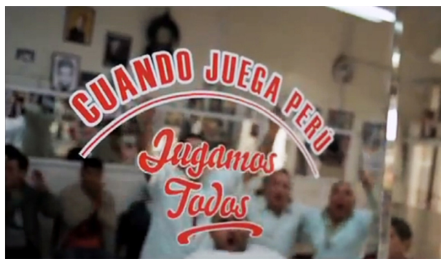
Figura 2 El llamamiento a la selección es representado como algo irrenunciable (Cristal Perú, 2011: 0'13").

Es revelador notar cómo una representación que se construye en primera instancia como una invitación (en este caso, a ser parte de la nación peruana a través del fútbol), pueda esconder debajo de sus texturas otro tipo de mensajes a priori no-dichos. Si los argumentos sobre lo nacional se discuten en torno a una ideología publicitaria que propone subirse al carro del aliento a la selección de fútbol a fin de sentirse, de cierta manera, incluido, ¿Qué ocurre con aquellas personas que no se sienten interpeladas con el supuesto sentimiento de pertenencia nacional que genera el fútbol? ¿Acaso serán menos parte de la nación? Y peor aún ¿Dónde quedan los peruanos de las zonas rurales alejadas que muy poco saben de los goles de Pizarro o Guerrero? ¿Quedarán