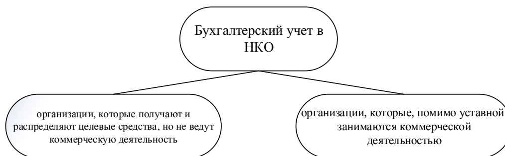
Рисунок 5 – Бухгалтерский учет в НКО

С точки зрения бухгалтерского учета НКО можно разделить на 2 группы (рисунок 5)