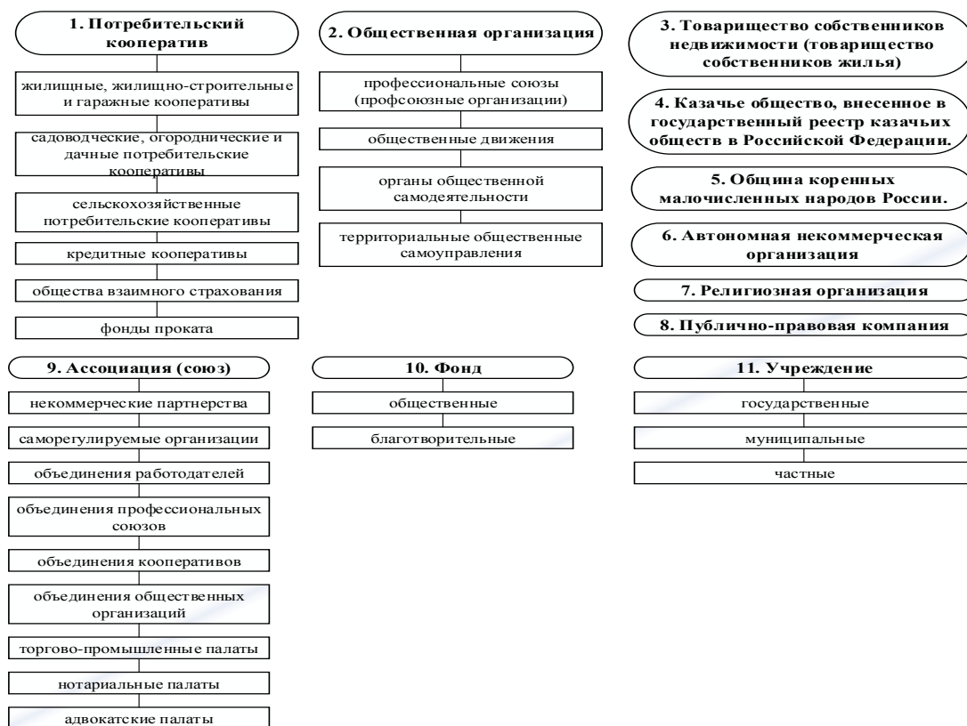
Рисунок 1 – Организационно-правовые формы НКО

Теперь некоммерческую организацию (далее НКО) можно будет организовать только в одной из 11 организационно-правовых форм (рисунок 1).