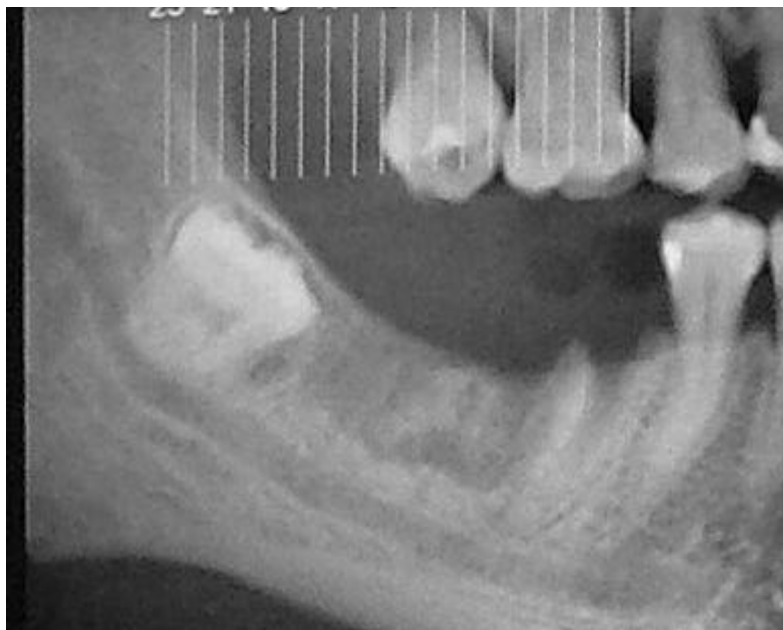
Figura 1 – Necrosis ósea postexodoncia de 4.6 y 4.7 estimulado por toilette excesiva.

Si la osteonecrosis debido a terapia crónica con bifosfonatos fuera simplemente una necrosis ósea avascular, se esperaría