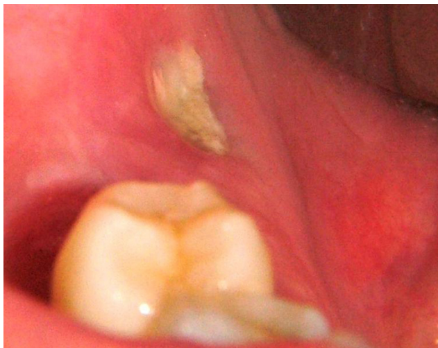
Figura 3 – Necrosis ósea espontánea zona retromolar sector 4.