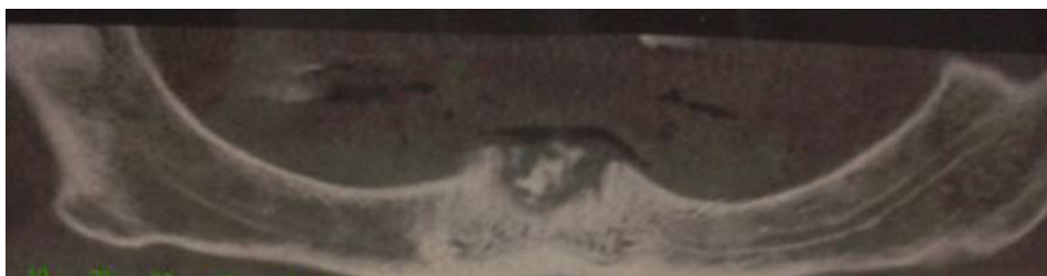
Figura 4 – Necrosis ósea postrauma protético post exodoncia de 4.1; 4.2; 3.1; 3.2.

su manifestación en demás estructuras óseas de la economía (cadera, rodilla por ejemplo) y no está claro cuál es el motivo de su predilección por los huesos maxilares, aunque se hipotetiza la relación directa con la función oclusal de los huesos maxilares respecto a la transmisión de fuerzas, promoviendo la respectiva cascada inflamatoria inductiva para provocar un recambio óseo a mayor velocidad que en otros huesos de la economía. También se piensa que la adición de flora con gran potencial anaerobio gramnegativo jugaría un importante papel 11,12 .