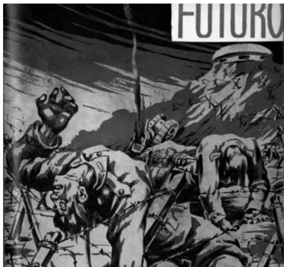
Imagen 5. Portada en Futuro , núm. 44, octubre, 1939