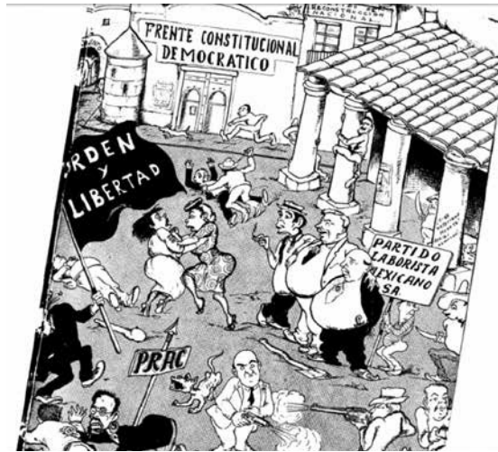
Imagen 1. “Defensores del orden”, en Futuro , núm. 43, septiembre, 1939, p. 31.

El ansia renovadora que suscita también se crea y re-crea en los paratextos ilustrados, que en cierto modo también sugieren una performatividad discursiva aplicada a la realidad convulsa de México en la revista Futuro , que puede observarse en la imagen y que se ha titulado, “Defensores del orden”.