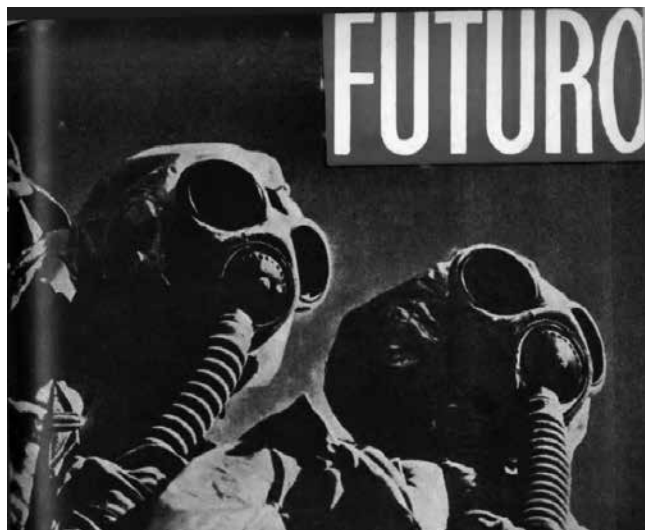
Imagen 4. Portada en Futuro , núm. 42, agosto, 1939.

Medio millón de antifascistas españoles —en números redondos— logró escapar a la barbarie franquista, refugiándose en el Extranjero, ora través de la frontera pirenaica, ora partiendo de los puertos mediterráneos leales, rumbo a Francia o al N. de África. ¿Cuál ha sido la suerte de estos desventurados, cuyo único delito fue defender la independencia de su patria, al tiempo que luchaban por la libertad del mundo? 52