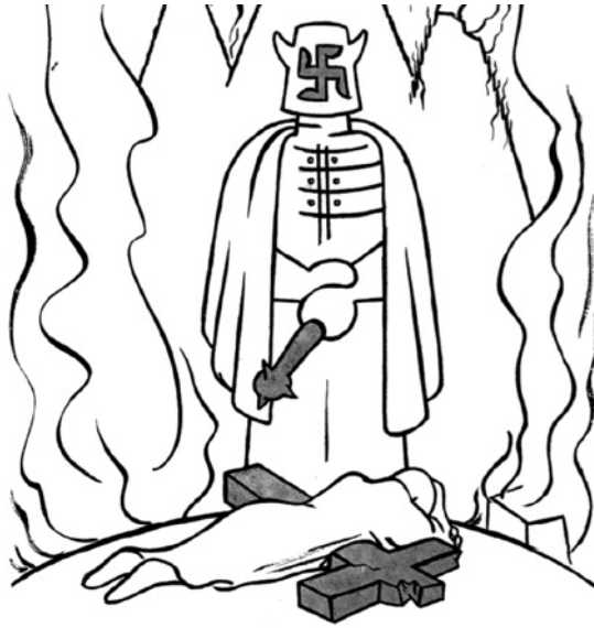
Imagen 3. Guerrero, X. “Paz con paz, guerra con guerra”, en Futuro , núm 44, octubre, 1939, p. 16.

encarnado en un sacerdote que, desde el infierno y cubierto con una máscara que tiene una esvástica, condena a los inocentes en nombre del catolicismo. Las imágenes performativas y el discurso cargado de imágenes sensoriales contribuyen en la creación (poiesis) de una atmósfera terrible.