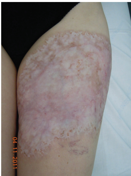
Figura 3 – Lesão totalmente cicatrizada, após 11 meses de tratamento, na face anterior da coxa esquerda.

com PG geralmente tem fator reumatoide positivo e erosões no Raio X são comuns. A AR afeta mulheres duas vezes mais do que os homens e sua incidência aumenta com a idade. Quando envolve outros órgãos, a morbidade e a gravidade da doença são maiores, podendo diminuir a expectativa de vida em cinco a dez anos. O diagnóstico depende da associação de uma série de sintomas e sinais clínicos, achados laboratoriais e radiográficos. A paciente descrita apresentava AR há 10 anos e realizava tratamento irregular, o qual precipitou o desenvolvimento das lesões de PG.