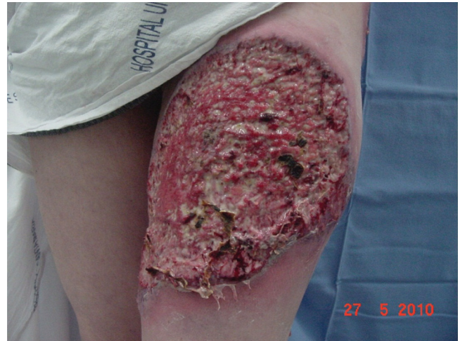
Figura 1 – Lesão ulcerada com bordas eritemato-violáceas escavadas e centro com áreas de necrose na face anterior da coxa esquerda.

Paciente 40 anos, feminina, branca, com histórico de AR há 10 anos, iniciou há dois meses com nódulos eritematosos na coxa e glúteo à esquerda, que ulceraram e evoluíram para úlceras extensas com mais de 10 cm de diâmetro. O quadro clínico começou logo após ter parado abruptamente o uso do corticoide oral. A paciente usava irregularmente as medicações modificadoras do curso de doença (DMCD), tendo abandonado o uso de Metotrexato há cerca de 2 anos. Ao exame físico, apresentava úlceras de fundo necrótico, bem delimitadas com bordas violáceas escavadas e com halo eritematovioláceo (fig. 1). Além disto, visualizavam-se deformidades articulares compatíveis com dedos em pescoço de cisne, dedos em boteira e desvio ulnar dos quirodáctilos. Biópsia de pele revelou processo inflamatório com vasculite neutrofílica e necrose fibrinóide de parede vascular sugestivas de PG (fig. 2). Culturas para fungos e bactérias não demonstraram crescimento de micro-organismos. Exames laboratoriais, incluindo sorologias para hepatite B, hepatite C, anti-HIV e proteinograma estavam todos normais, exceto provas inflamatórias aumentadas e o fator reumatoide em altos títulos. Raios X das mãos e pés demonstravam erosões ósseas em articulações interfalangeanas proximais, metacarpofalangeanas e metatarsofalangeanas. O tra-