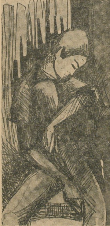
Çavidan Y. Erten

"Erenler sohbetinde Deste kızıl gül idim Açıldım ele geldim Soldum ise ne oldu."