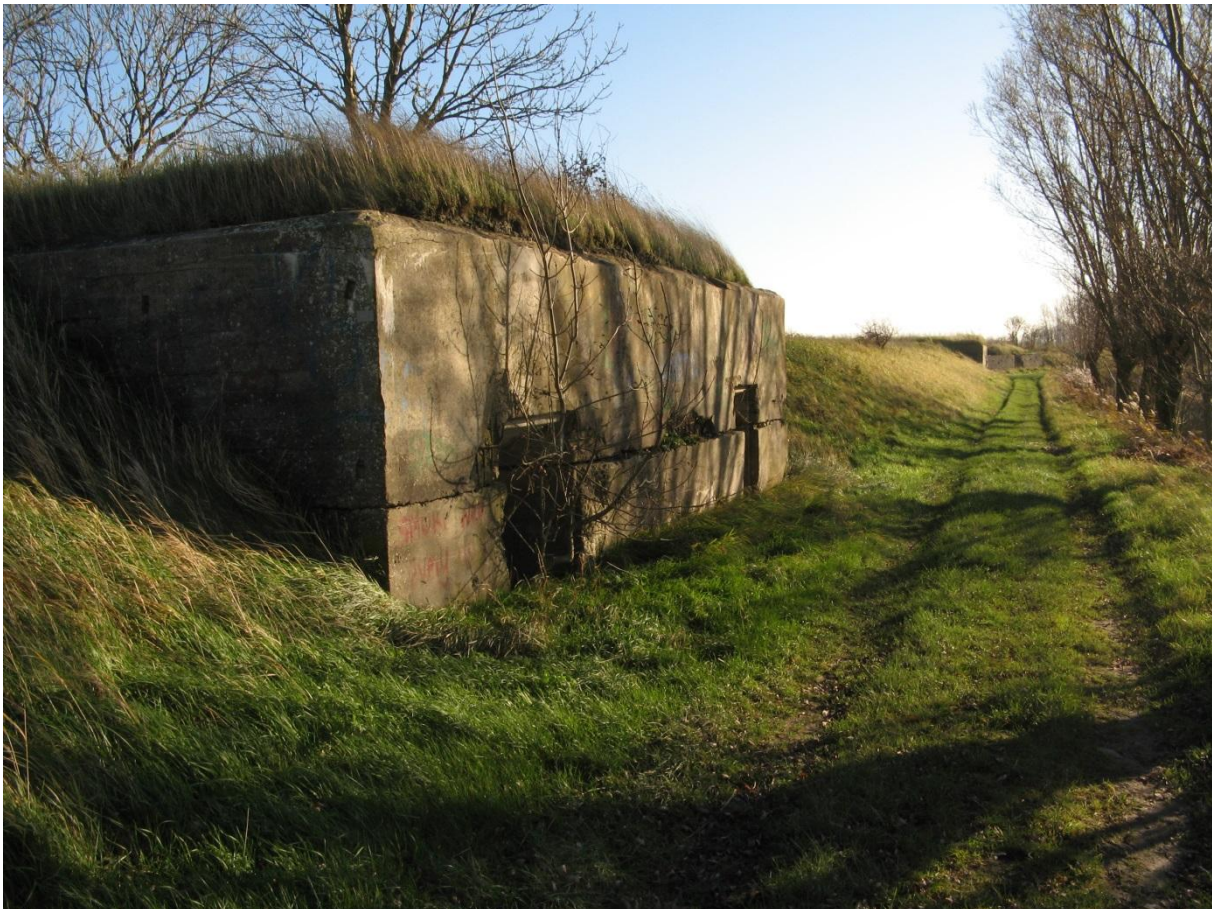
Foto. In de Hazegraspolderdijk ingebouwde bunkers, die een aanzienlijk potentieel als winterverblijfplaats voor vleermuizen hebben (foto E. Cosyns, november 2012).