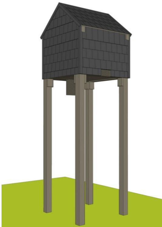
Figuur 6.2. Een vleermuistoren ( naar het voorbeeld van Nete in Vorselaar).

Uit de éénmalige inventarisatie blijkt dat er langsheen de Zeedijk een vliegroute is van Gewone dwergvleermuizen. Verder worden tijdens de inventarisatie ook opvallend veel Laatvliegers waargenomen. Aan Nederlandse zijde werden Watervleermuis, Gewone en Ruige dwergvleermuis vastgesteld (adviesbureau Wieland, 2014). Watervleermuis verblijft overdag voornamelijk in boomholtes en foerageert vooral boven waterlopen. Bomenrijen en andere landschaps elementen worden gebruikt om van het ene naar het andere gebied te vliegen. In de bomenrij langs het afwateringskanaal zijn geschikte (potentiële) dagverblijven aanwezig. Tijdens het onderzoek is niet vastgesteld dat Watervleermuizen hier gebruik van maken. Langs dezelfde bomenrij is een baltsende Ruige dwergvleermuis waargenomen. Dit wijst er op dat de holtes/loszittende schors, die in deze bomenrij aanwezig is, gebruikt wordt als dagverblijf/paarverblijf (adviesbureau Wieland, 2014). Tijdens de telavonden ten behoeve van het Boomkikkeronderzoek werden in 2013 in vergelijking tot vorige jaren meer jagende Gewone dwergvleermuizen en ook enkele Ruige dwergvleermuizen gespot. Nieuw voor het VNR Zwinduinen en -Polders is de aanwezigheid van 3 jagende watervleermuizen boven de waterpartijen van het uitkijkplatform (Van Torre, med. ).