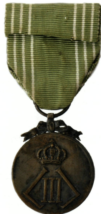
keerzijde variatie 4 van Zee-eretekens