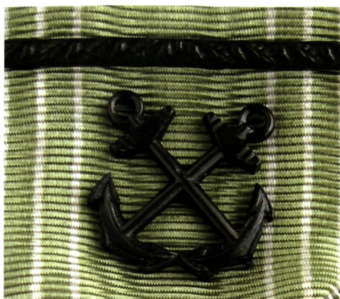
Detail Zee-eretekens met streep