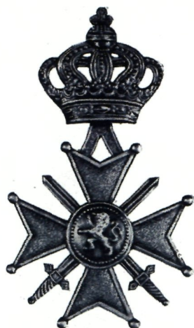
de la CROIX DE GUERRE