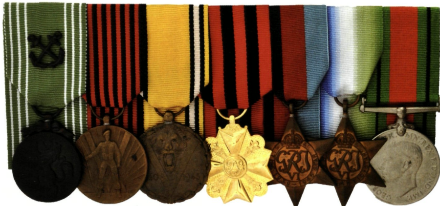
de eretekens van Maurice Mommens

It is not considered necessary to issue a Fleet Order because, with a few exceptions, the Belgian ratings all belong to the Devonport Division, and it seems probable that Commodore Devonport would be able to supply the required information without much difficulty.