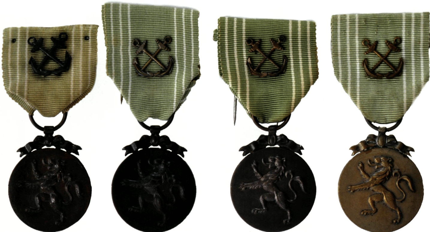
variëties van Zee-eretecken