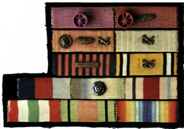
de lintjes van commodore Lurquin