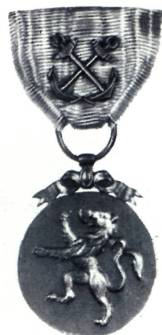
de la MÉDAILLE MARITIME