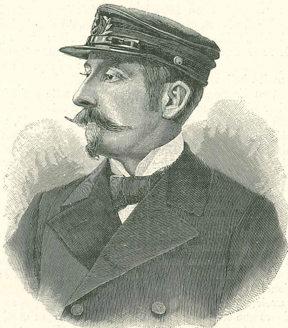
L'EXPÉDITION BELGE AU PÔLE ANTARCTIQUE. M. von Gerlach, capitaine de la Belgica .