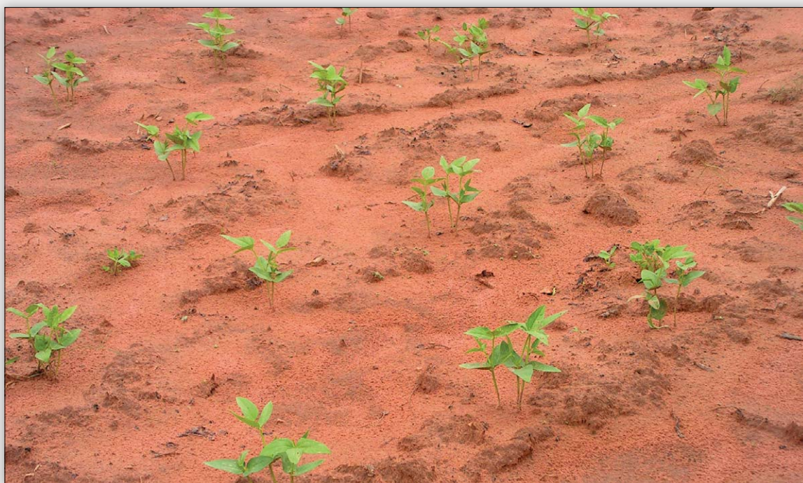
Fig. 3 Essai de niébé fourrager planté à la fin de la saison des pluies à Koutiala (Mali)

La stabulation améliore la productivité de la vache et assure une meilleure croissance du veau. Elle permet de faire une économie d'énergie et augmente la disponibilité de la fumure organique ce qui assure le maintien de la fertilité des sols. En outre, elle contribue à l'amélioration de la nutrition des enfants.