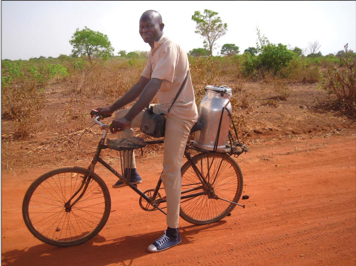
Fig. 1 Agriculteur en train de traire sa vache pendant la stabulation saisonnière et le lait étant transporté sur le marché (Koutiala, Mali) Fig. 1 Farmer milking his cow during the seasonal stable feeding and milk being transported to the market (Koutiala, Mali)