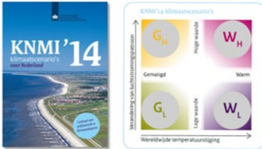
Figuur 4: Vier KNMI'14 scenario's voor klimaatverandering in Nederland.