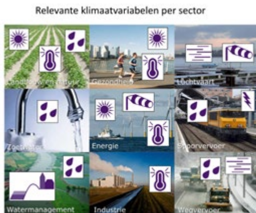
Figuur 5: Klimaatvariabelen (pictogrammen) die het meest relevant zijn voor genoemde sectoren.

De gebruikers willen vooral weten hoe bij elk scenario de kans op extreem weer verandert. Daarvoor hebben we eerst per sector gekeken naar de meest relevante klimaatvariabele (Figuur 5). Vervolgens zijn in overleg met de gebruikers indices en indicatoren gekozen die het meest relevant zijn voor de belangrijkste toepassingen in de betreffende sector. Bijvoorbeeld voor de energiesector is gekozen voor een index als maat voor de stookkosten in de winter gebaseerd op de temperatuur (Figuur 6). De 4 scenario's voor het midden en het einde van de eeuw zijn aangegeven met de kleuren. Je ziet dat we in het huidige klimaat al duidelijk minder hoeven te stoken dan in het verleden en dat dit in de toekomst nog beduidend minder wordt. Als we