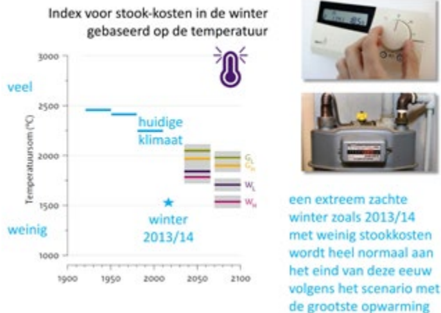
Figuur 6: Index voor het gebruik van gas en energie, deels gebaseerd op waarnemingen in De Bilt, deels gebaseerd op berekeningen volgens de vier KNMI'14-scenario's voor 2050 en 2085. Som van de afwijkingen ten opzichte van 17° C voor alle dagen met een gemiddelde temperatuur van minder dan 17° C; bijvoorbeeld, een daggemiddelde temperatuur van 14° C voegt 3 graaddagen toe; een daggemiddelde temperatuur van -2° C voegt 19 graaddagen toe.

nu een individuele winter in dezelfde figuur plotten, dan blijkt dat een extreem zachte winter met weinig stookkosten die we in 2013/14 hebben gekend heel normaal zal zijn aan het eind van deze eeuw volgens het scenario met de grootste opwarming.