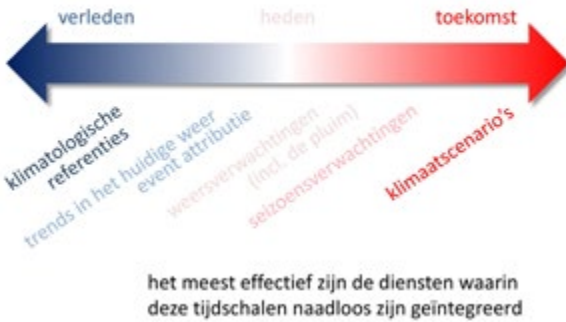
Figuur 3: Naadloze overgang tussen tijdschalen in klimaatdiensten.

Maar wat verstaan we nu onder klimaatdiensten? Klimaatdiensten omvatten alle routinematig beschikbaar gestelde bronnen van informatie over klimaatverandering die bruikbaar zijn in praktische toepassingen. Die toepassingen variëren van het beperken van klimaatverandering (aangeduid met mitigatie) tot het aanpassen aan onvermijdelijke klimaatverandering (aangeduid met adaptatie). Maar ook het reduceren van risico's op rampen (aangeduid met disaster risk reduction) en het tijdig waarschuwen voor extreem weer (aangeduid met early warning) vallen eronder. Klimaatdiensten sluiten direct aan op weerdiensten, zoals de weersverwachting voor morgen.