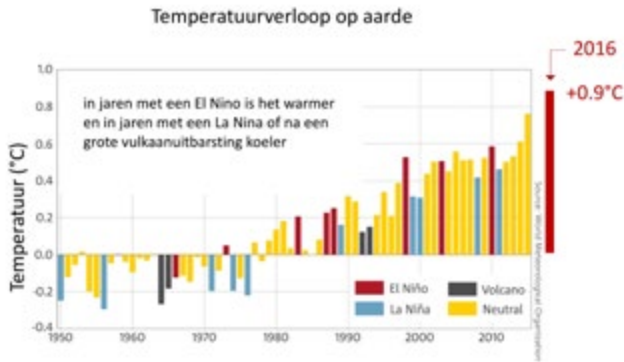
Figuur 1: Jaargemiddelde temperatuur (in °C) op aarde sinds 1950 ten opzichte van het gemiddelde in het tijdvak 1961-1990.

De metingen laten dus zien dat de aarde is opgewarmd. Volgens het laatste rapport van het VN-klimaatpanel IPCC ligt de temperatuur gemiddeld over de aarde nu ongeveer één graad hoger dan 150 jaar geleden 4 . Dat was aan het begin van het industriële tijdperk in de westerse wereld. In Nederland steeg de temperatuur na 1950 zelfs twee keer zo snel. En de temperatuur op aarde blijft stijgen in de toekomst. De conclusie van het IPCC is met ieder rapport overtuigender geworden: klimaatverandering is gaande en wordt mede veroorzaakt door de mens. Maar klimaatverandering omvat meer dan temperatuurstijging alleen. Wereldwijd nemen eveneens de risico's van weer- en klimaatextremen toe, zoals hittegolven en hevige regenbuien. Dat komt deels doordat steeds meer mensen op kwetsbare plekken wonen, zoals dicht aan de kust bij een stijgende zeespiegel.