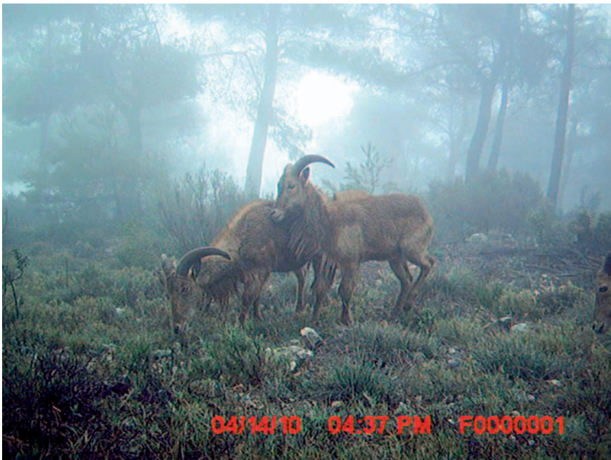
Figura 2. Detalle del arruí ( Ammotragus lervia ) mediante trampeo fotográfico.

La metodología empleada para determinar la expansión del arruí, por el tercio norte de la provincia de Alicante y sur de la de Valencia, se ha basado en la técnica conocida como fototrampeo. El trampeo fotográfico es una práctica no invasiva utilizada en diversas áreas de conocimiento, como la investigación de la fauna silvestre, la gestión de especies de caza, el control de especies o la educación ambiental. Esta es una actividad en auge debido a la reciente incorporación y el abaratamiento de diversas tecnologías aplicadas a equipos fotográficos automatizados (p. ej.: los sensores de movimiento, las cámaras digitales, las tarjetas de memoria compacta, los flashes de infrarrojos o las baterías de larga duración). Estos equipos autónomos pueden ser colocados en lugares remotos durante varias semanas, incluso meses, sin tener que realizar mantenimiento alguno, por lo que se configuran como un recurso para la investigación de incomparable utilidad. En la figura 2, se puede ver un ejemplo de imagen tomada con cámaras de fototrampeo (Belda et al., 2009).