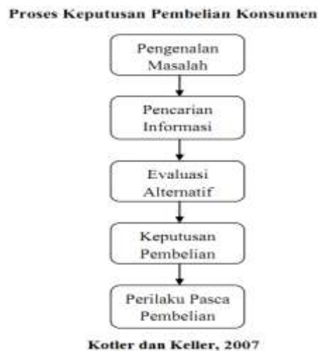
Gambar 2.1 Proses Keputusan Pembelian Konsumen

Gambar diatas merupakan tahapan proses keputusan pembelian konsumen yang terdiri dari