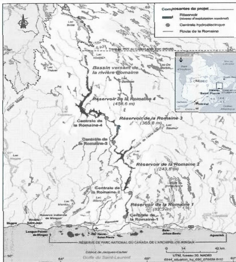
Figure 2 : Localisation du projet d'aménagement du complexe de la Romaine