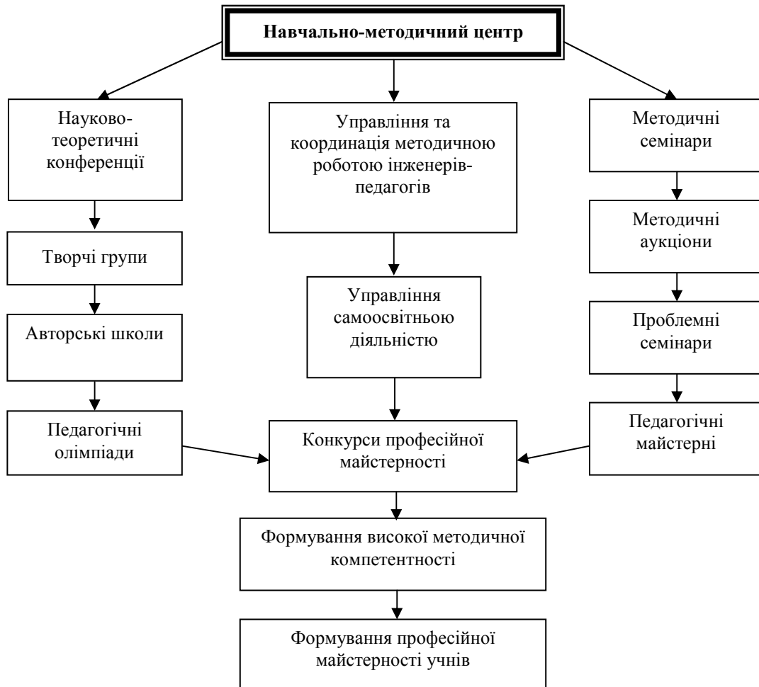
Рис. 3. Сучасні колективні форми методичної роботи.

Участь інженерно-педагогічних працівників в сучасних колективних формах методичної роботи, таких як методичні і проблемні семінари, творчі і проблемні групи, авторські школи, педагогічні олімпіади, конкурси професійної майстерності і конкурси «Педагог року», формують їх високу професійно-педагогічну і методичну компетентність (рис. 3).