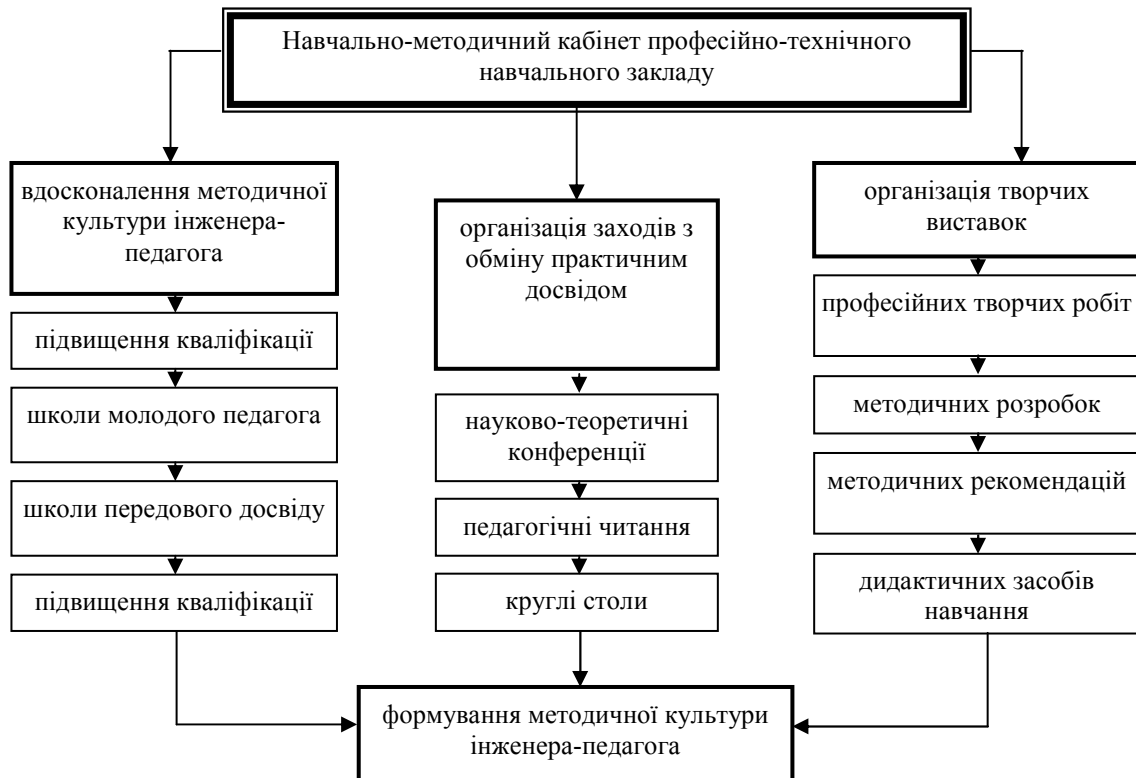
Рис. 2. Напрями діяльності навчально-методичного кабінету професійно-технічного навчального закладу.

Для розвитку професійно-педагогічного рівня інженера-педагога професійно-технічного навчального закладу використовуються різні форми методичної роботи, утворюючи оптимальний варіант неперервного процесу удосконалення його професійно-педагогічної компетентності. До таких форм від-