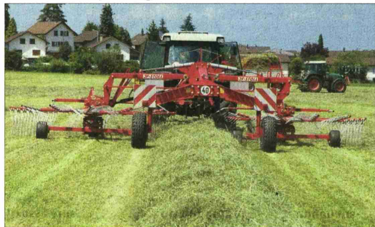
Grosse Maschinen haben oft nur eine geringe Stundenauslastung und verursachen somit hohe Fixkosten.