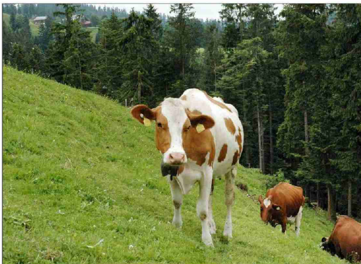
In der Biomilchproduktion gibt es unterschiedliche Möglichkeiten, die Kosten zu senken.