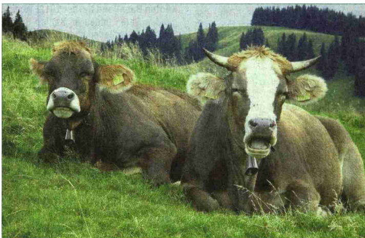
Mit der Sömmerung von Bio-Weide-Beef-Tieren lässt sich die saisonale Arbeitsspitze deutlich verringern.

Anmeldung beim FiBL-Kurssekretariat, Frick, Tel. 062 865 72 74 oder unter www.anmeldeservice.fibl.org .