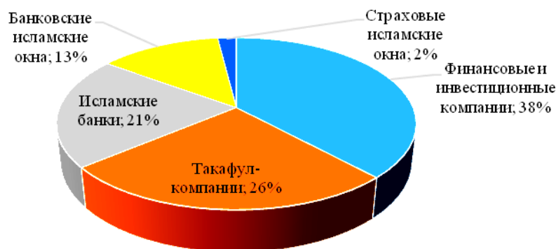
Рис. 1. Мировой рынок исламских финансовых институтов, 2010 г.[4]

В структуре мирового рынка исламских финансовых институтов такафул является одним из крупнейших сегментов (рис. 1).