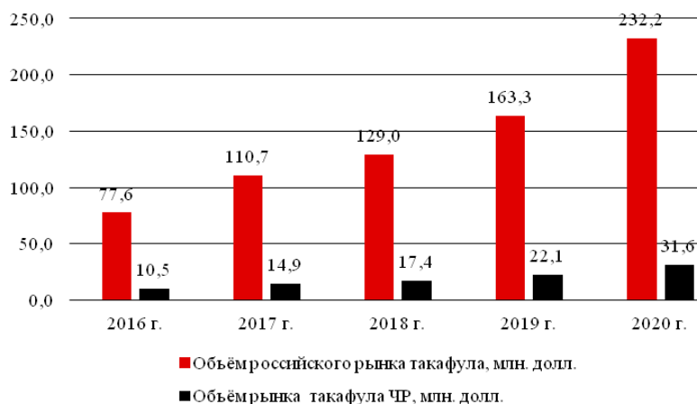
Р и с .4. Расчёт прогнозной ёмкости рынка такафула в РФ и ЧР на 2016 – 2020 гг.

Как видно, при условии принятия правовых, институциональных и рыночных мер, потенциал развития рынка исламского страхования действительно велик, при том, что прогнозные оценки осуществлялись на основе допущений по минимальным значениям основных прогнозных параметров.