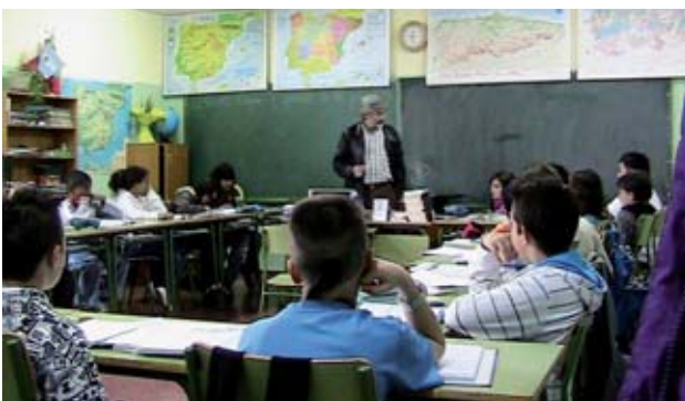
Momento de enseñanza-aprendizaje en el aula.

Este artículo fue solicitado por PADRES y MAESTROS en abril de 2013, revisado y aceptado en agosto de 2013 para su publicación.