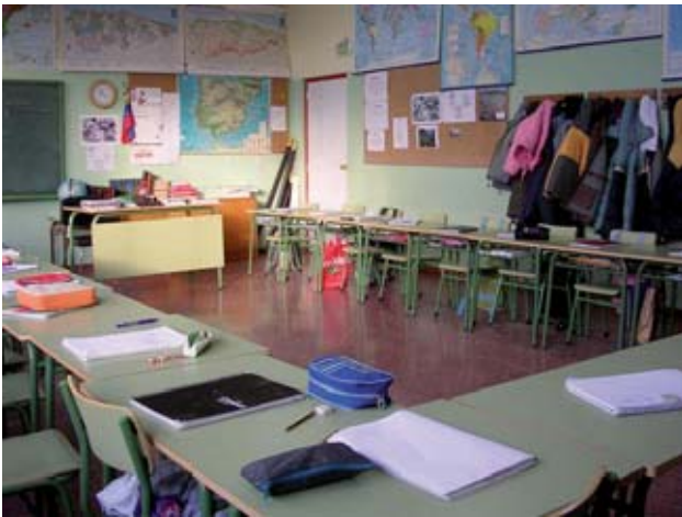
Aula de trabajo en la que se ha desarrollado la investigación.