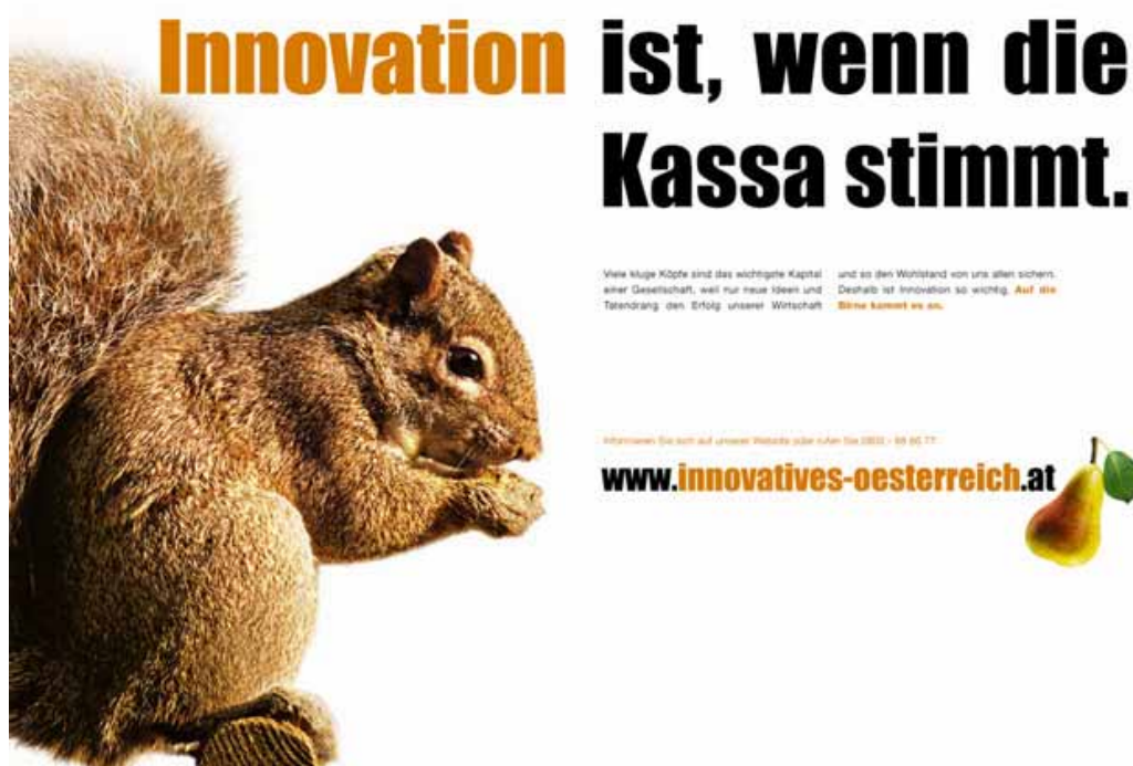
Abbildung 1: Kampagne „Innovatives Österreich“