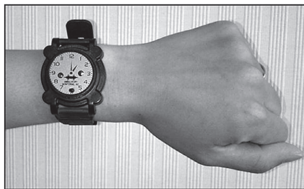
写真1 アクティグラフ

対象者に対し、継続的かつ非侵襲的に睡眠/覚醒判定を行い、睡眠状況を比較するため、本研究ではアクティグラフ(米国A.M.I社製AW2 写真1)およびスリープスキャン(TANITA社製SL-501 写真2)を併用した。また、アクティグラフは対象者の非利き手に、睡眠指標を把握するのに必要な連続3日間装着し 6) 、入浴時のみ外した。スリープスキャンは、対象者のマットレスもしくは布団の下に連続3日間設置し、期間内は布団の上げ下ろしやマットレスの移動を行わないこ