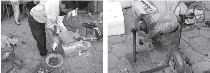
(出所) 2011年9月9日、中国大連の労働公園にて筆者撮影。