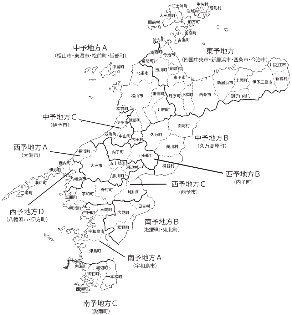
図1 愛媛県のポン菓子の呼称と食文化

(出所) 市町村再編前の愛媛県の自治体 (2003年3月31日) をもとに筆者が加筆した。