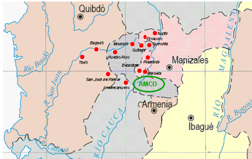
Mapa 1: Presencia Embera en el Área Metropolitana Centro Occidente AMCO Fuente: Territorios indígenas dentro de la zona de influencia del AMCO, localización aproximada, 2002 William Mejía Ochoa