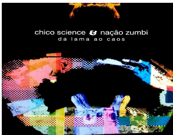
Figura1: Capa do disco Da Lama ao Caos . Imagem: Helder Aragão

Em um tempo em que o disco de vinil possuía importância enquanto suporte visual, sua capa estampava a imagem manipulada digitalmente de um caranguejo, com colagens em cores vibrantes e formas caóticas. Combinada com o título do disco, essa imagem compunha a proposta de um discurso que, embora destinado ao ambiente pop urbano, se inspirava no estuário lamacento.