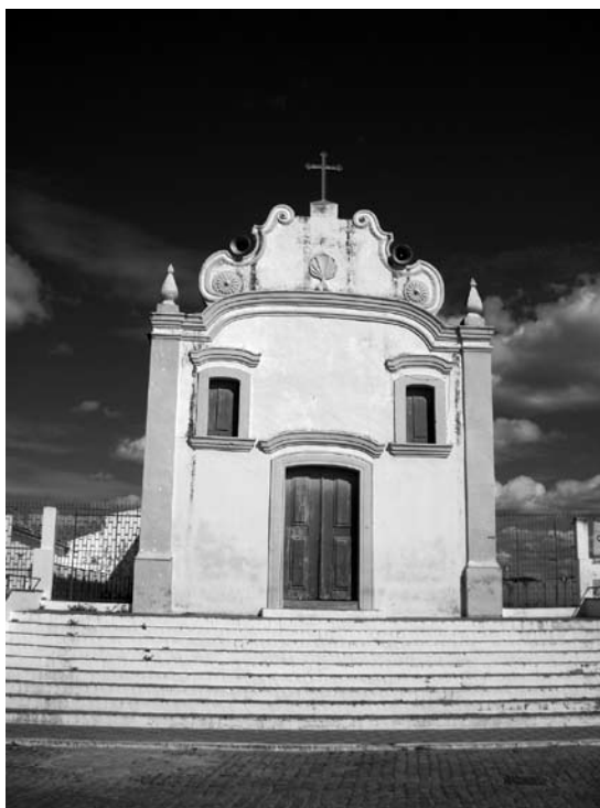
Igreja do Rosário, Acari (RN) (J. Cavignac, fev. 2007).

Presentes em todo Brasil, as festas das irmandades pretas foram incentivadas pela Igreja como parte do esforço de evangelização e controle das populações escravizadas, sendo encontradas com grande frequência ainda nos séculos XIX e XX, em todo território brasileiro (ABREU, 1994; CARVALHO, 1998; CORD, 2003). No Nordeste, a Festa de Nossa Senhora do Rosário dos Homens Pretos existe desde o fim do século XVII, com a primeira coroação dos Reis do Congo em Recife em 1674 (CASCUDO, 1980, p. 44). Encontramos o primeiro registro da festa em Caicó, no ano de 1771, e, no decorrer do século XIX, nas outras cidades do Seridó (AZEVEDO, 1962-1963, p. 32; DANTAS, 1961, p. 56-62; LAMARTINE, 1965, p. 69-80; MEDEIROS, 1985, p. 25-26). 17 Podemos pensar que as irmandades negras se desenvolveram, sobretudo no século XIX, com a cultura do algodão, que fez a fortuna de famílias renomadas na região.