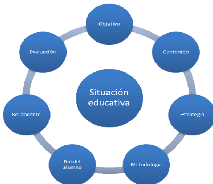
FIGURA 2. COMPONENTES DE LA SITUACIÓN EDUCATIVA EN MATEMÁTICAS.

La situación educativa en la que se involucró a los estudiantes de secundaria, con un ambiente de aprendizaje utilizando la técnica POL para desarrollar las competencias matemáticas se esquematiza en la Figura 2: