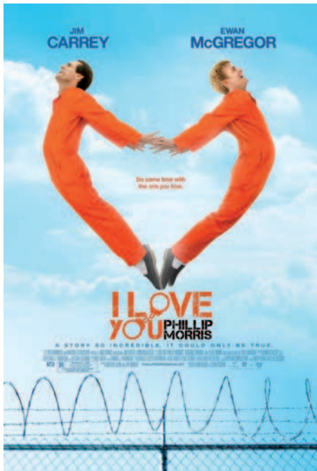
Figura 3. Cartel e imagen que actualmente se difunde de la película I Love You Phillip Morris .