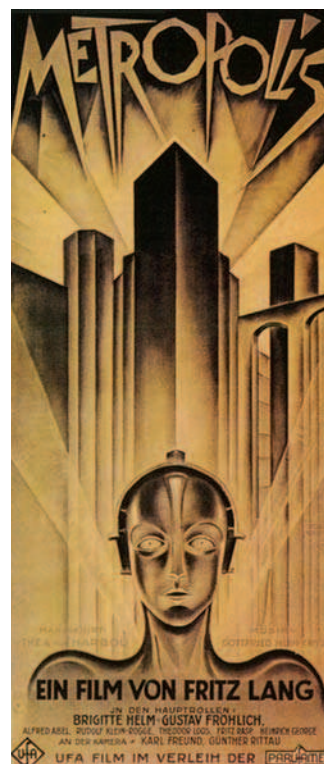
Figura 1. Cartel de la película Metrópolis , dirigida por Fritz Lang en 1927. Diseño del ilustrador alemán Heinz Schulz-Neudamm.

Las convenciones académicas tradicionales de la educación artística han fundamentado su acción en un modelo que redundaba en las denominadas «bellas artes». Desde hace tiempo este modelo ya no es exclusivo, de modo que