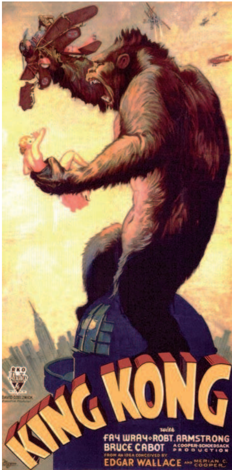
Figura 2. Cartel diseñado por S. Barret McCormick y Bob Sisk para el film de Merian C. Cooper y Ernest B. Shoedsack del año 1933.

los artefactos visuales como pueden ser la fotografía, el cine, el vídeo, la televisión o los videojuegos han empezado a introducirse en las experiencias educativas, lo cual es una muestra palpable de lo que debería ser un nuevo concepto de la educación artística. Aun así, una manifestación de primer orden como el cine no encuentra el territorio adecuado para afianzar un modelo en el cual pudiesen converger todas las dinámicas emergentes.