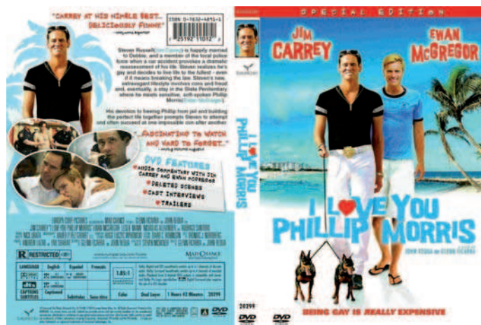
Figura 5. Carátula de la edición especial del film en DVD.

Nos llama la atención que las letras originales del título, que acompañaron a la promoción de la película, supuestamente diseñadas por Richie Adams y producidas por Scott Poché, en realidad desaparecen cuando vemos la carátula de la edición en DVD. Suponemos que a lo largo del recorrido comercial de la película hubo cambios de estrategia comunicativa, y es por ello que en la portada de la carátula ya vemos ubicada adecuadamente una nueva tipografía explícita, con la cual se han escrito tanto los nombres de los actores principales como el título del film. Es el mismo fondo que aparece como escenario digital en los extras del DVD, que contiene las entrevistas a los directores y los actores. Así pues, los grafismos originales han sido desplazados por un modelo tipográfico más legible aunque menos original que el oriundo.