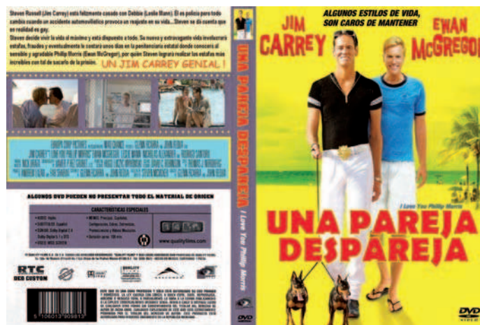
Figura 6. Carátula de la edición mejicana del film en DVD.