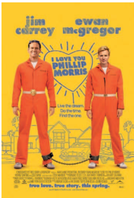
Figura 4. Cartel de la película que responde a los cánones estéticos iniciales marcados por los creativos gráficos.

internacional y también tuvo una razonable aceptación por parte de la crítica. Lo que nos llama la atención es la disparidad de factores visuales que la ha acompañado en su periplo por los diversos países en los que se ha difundido, así como los constantes cambios de imagen, incluso en su trayectoria anglosajona.