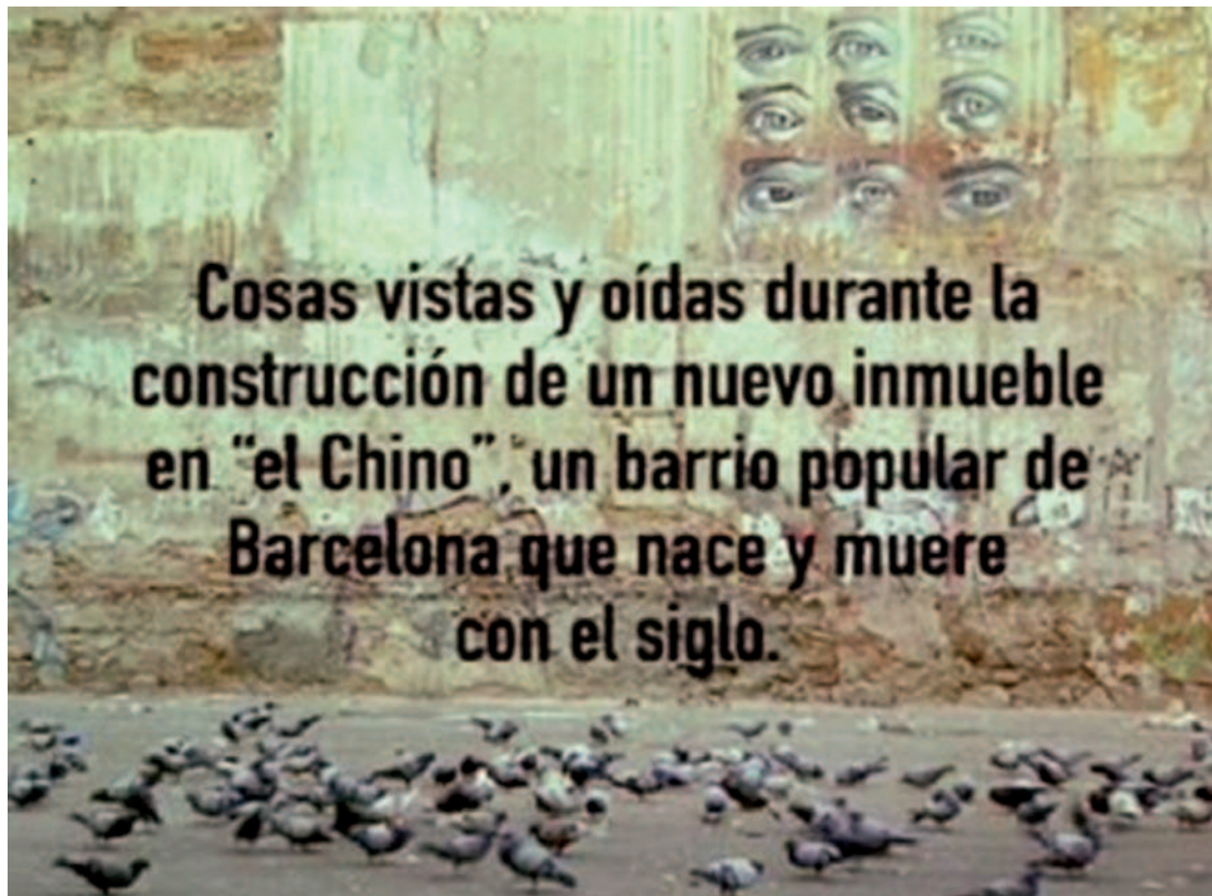
Figura 8. Frase con la que se inicia la película documental En construcción .

El inicio del film es un fondo negro en el que van apareciendo con letras blancas los nombres de las entidades que han colaborado en la producción. Tras esta concesión lógica vemos un montaje documental con imágenes en blanco y negro en el cual se repasa, en pocos minutos, todo un siglo de tradición: el ambiente del Raval barcelonés en los inicios del siglo XX; la zona de prostitución en imágenes de los años 1950 y 1960, y un recorrido de un cámara persiguiendo a un marine norteamericano que deambula zigzagueando por la zona final de las Ramblas y finalmente desaparece en una calle del Raval. Esta deliciosa introducción da paso a una imagen fija de una pared (todo el film es una sucesión de planos fijos de gran empaque visual) sobre la cual aparecerá el título de la película, el nombre del director, y posteriormente un texto introductorio, tal y como lo vemos en la figura 8 .