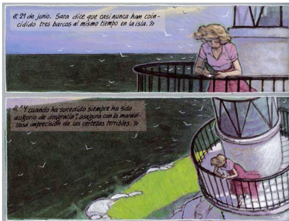
Trazo de tiza , de Miguelanxo Prado (2003: 30).

Las anotaciones de Ana se incluyen a modo de didascalias y aportan diferentes contenidos. A través de algunas de ellas se accede a una descripción objetiva de lo que sucede: “13 de junio. Hoy, a media tarde, ha llegado otro barco. Hace calor” (2003: 14); otras muchas explicitan sus percepciones personales: “Las gaviotas, flotando lentas en el aire denso, se lamentan con voces de niño y tono lastimoso, retazos desprendidos del faro blanco, del dique blanco, de la isla blanca” (2003: 22). Todos ellos son comentarios que nunca llegan a verbalizarse a lo largo de la narración, de forma que se le concede al lector el privilegio de acceder a sus más recónditos pensamientos.