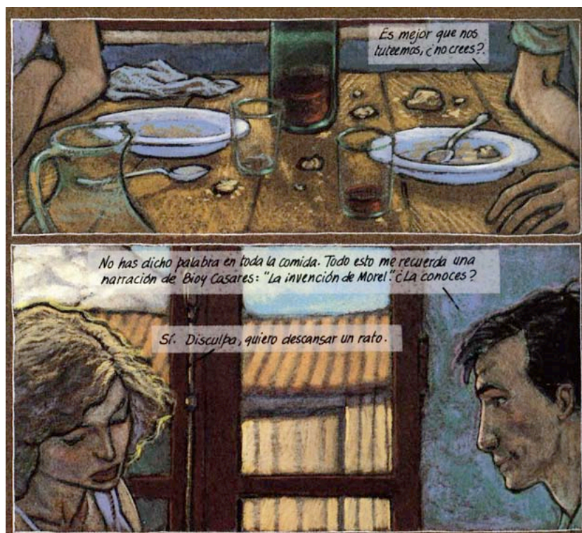
Trazo de tiza , de Miguelanxo Prado (2003: 20).

En la siguiente conversación que mantienen los protagonistas surge una nueva conexión intertextual que entronca con un juego planteado en La invención de Morel . Stoever, uno de los personajes de la novela de Bioy Casares, declama un conjunto de versos 8 que, en principio, no se asocia a ningún poeta. Seguidamente, desvelará que son de Verlaine y el lector deberá fiarse de tal apunte si no los reconoce. Del mismo modo, en Trazo de tiza , Raúl cita el verso “Inutile phare de la nuit” (2003: 23) que Ana atribuye inmediatamente a François-René Chateaubriand. De la respuesta de Raúl se deduce que la cita ha sido indirecta, a partir del autor Antonio Tabucchi, hecho que amplía el entramado intertextual y permite dar el salto a una nueva ficción, Dama de Porto Pim . Ante este hecho, Ana se muestra tajante y afirma que “es una frívola temeridad citar sin conocer las fuentes” (2003: 23). Los personajes se convierten tanto en transmisores directos de los contenidos intertextuales como en piezas clave capaces de activar la reflexión sobre la propia ficción que se está desarrollando. De este diálogo se deduce una concepción de la literatura como continuum de obras interconectadas ante el cual el lector puede perder la perspectiva a la hora de relacionar contenidos y títulos.