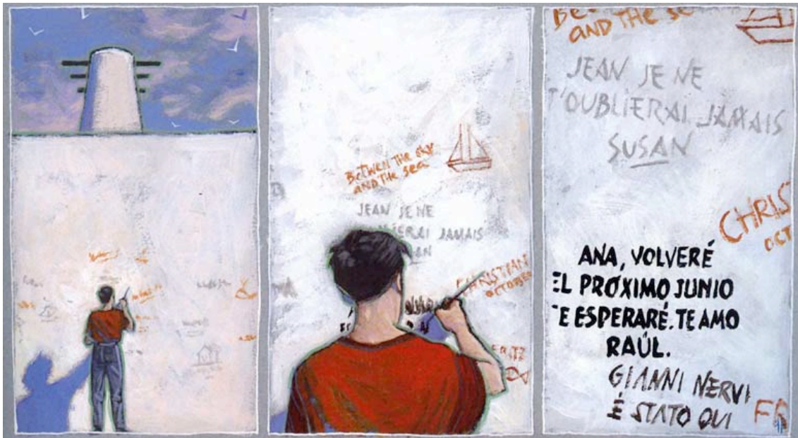
Trazo de tiza , de Miguelanxo Prado (2003:83).

Por otra parte, los sistemas de comunicación a los que recurren tanto los personajes del relato de Tabucchi como los del cómic de Prado vienen condicionados por las características de la geografía en donde se desarrollan las historias. En el bar de la isla imaginada por el escritor italiano, el Peter's Bar , se encuentra un gran tablón de madera en el cual se acumulan numerosas notas a la espera de sus destinatarios: