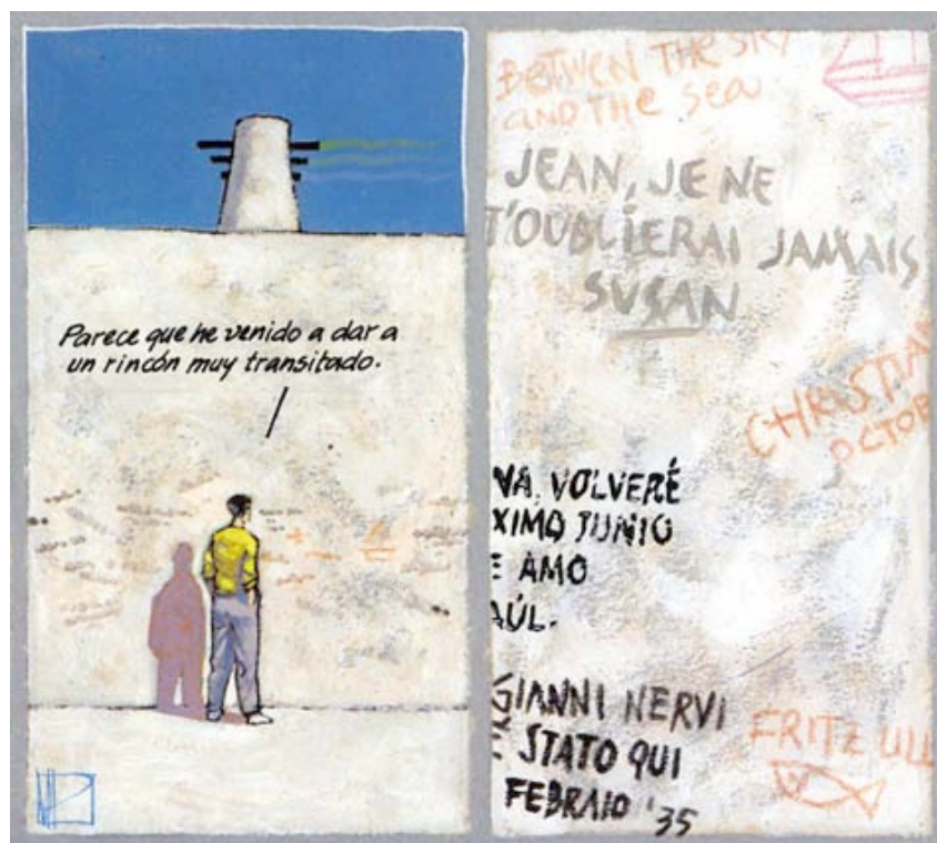
Trazo de tiza , de Miguelanxo Prado (2003: 11).

El motivo del muro, que se erige como pieza fundamental de la historia, está tomado, tal y como explica Prado en su “Anotación final”, del relato “Otros fragmentos”, donde se destacaba la existencia de un muro en la isla de Horta con una serie de inscripciones: