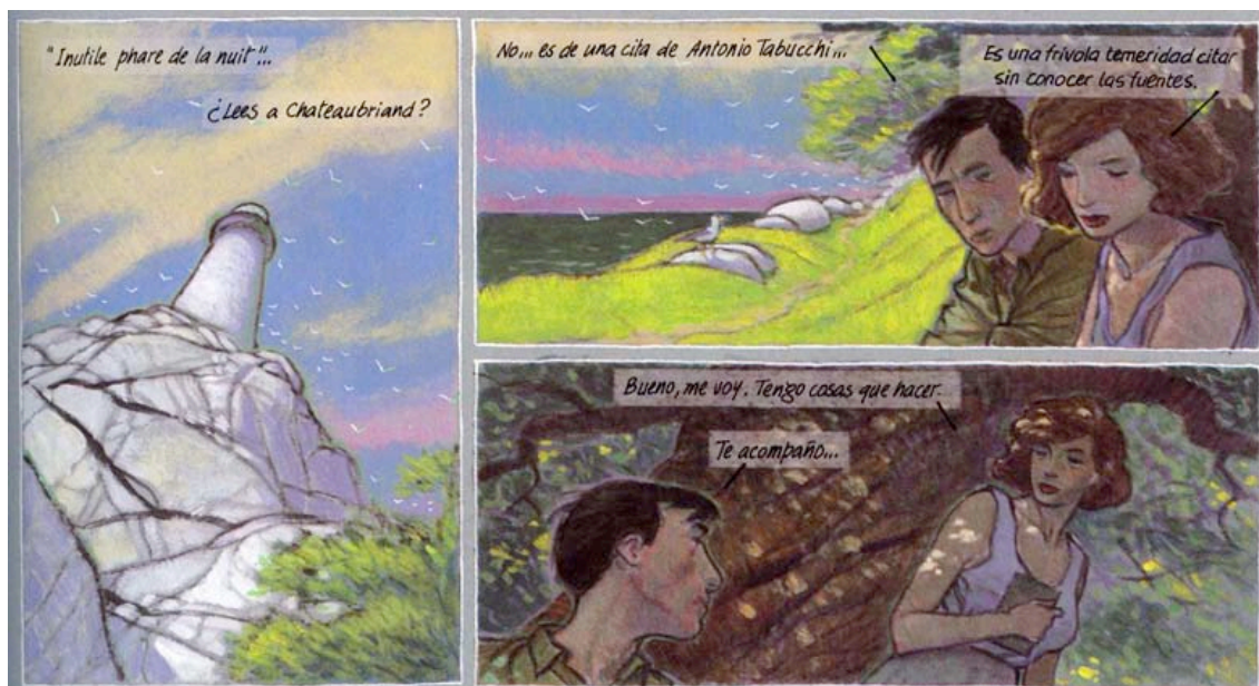
Trazo de tiza, de Miguelanxo Prado (2003: 23).

Si Raúl conoce a Chateaubriand a partir de Antonio Tabucchi es necesario acudir a la obra del autor italiano para captar las dimensiones reales del juego intertextual planteado. En “Otros fragmentos”, uno de los relatos incluidos en “Naufragios, derrelictos, tránsitos, lejanías”, primera parte de la Dama de Porto Pim 9 , el narrador se refiere a una isla lejana denominada Île de Pico :