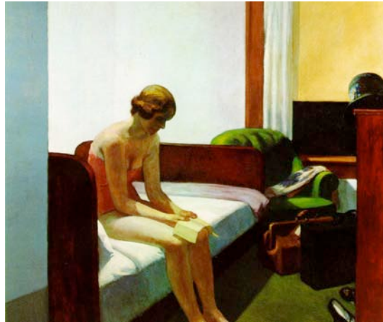
Edward Hopper. Habitación de hotel (1931)

del espectador en voyeur procede en Habitación de hotel de la inclusión hacia el fondo del lienzo del motivo de la ventana abierta, hacia la que se dirigen las líneas de perspectiva del cuadro, que supone una reduplicación metapictórica (como una ventana dentro del cuadro, esto es, como una ventana dentro de una ventana) y provoca un efecto de inversión (Alarcó, sin año) 6 .