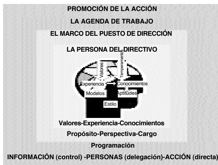
Figura 1. Un modelo de análisis de la figura del directivo