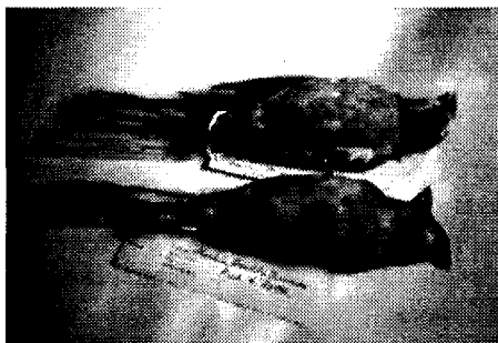
Foto 1. Macho y hembra de Gubernatrix cristata .