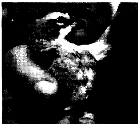
Foto 3. Híbrido entre Gubernatrix cristata x Diuca diuca , adulto (vista lateral).