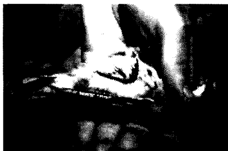
Foto 4. Híbrido entre Gubernatrix cristata x Diuca diuca , subadulto (vista ventral).