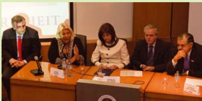
Gerardo Morales, Elisa Carrió, Patricia Bullrich, Federico Pinedo y Ricardo López Murphy (de izq. a der.) exponiendo en el último panel de la conferencia.

El Senador Morales realizó un análisis del contexto latinoameri-