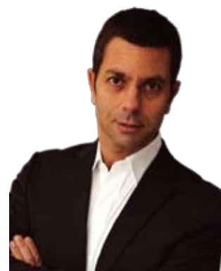
por Alejandro Mascó , Oxford Partners.

Antes del año 2000, no hace tanto tiempo, no existía ninguna herramienta que permitiera a los reclutadores llegar directamente a los candidatos. Existían las bolsas de trabajo pero las alertas por e-mail y la misma existencia del correo electrónico, así como Internet, eran extrañas al mundo laboral.