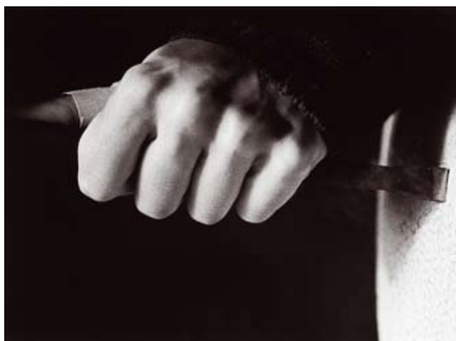
"La mano, el golpe" | gelatina plata 50 x 60 cm.

MICHEL MARCU , fotógrafo, se inicia en la fotografía a los 14 años con un curso breve en la YMCA. En 1967, a los 17 años, realiza un viaje de 30.000 km. a dedo por Sudamérica y lo documenta con unas pocas diapositivas que intentaron mostrar un mundo hoy desaparecido.