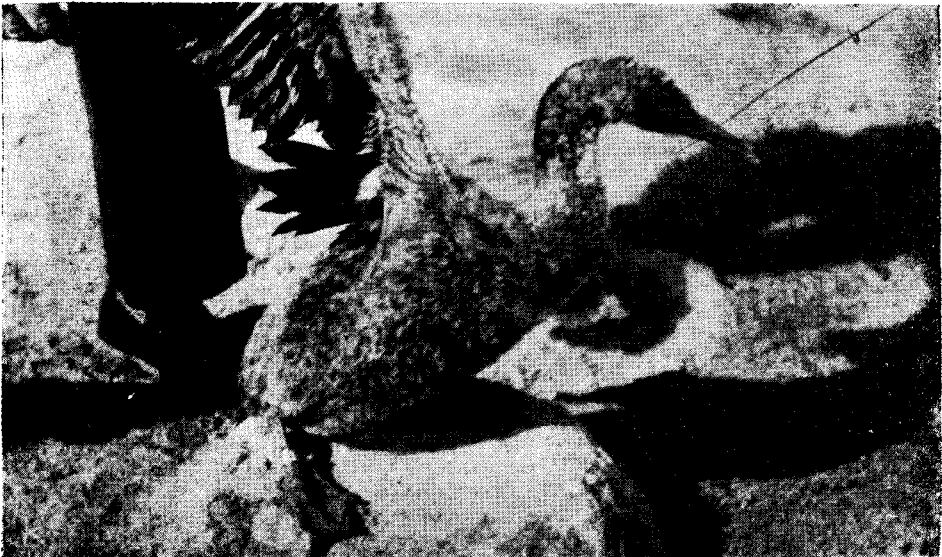
Figura 7. Pichón de Guanay ( Phalacrocorax bougainvillii ) de un primer lote anillado en la Argentina para investigar la ruta migratoria de esta interesante especie que desde hace un lustro nida en el paraje de punta Tombo, Chubut.

Resumiendo, en las seis campañas referidas se han anillado 4.785 individuos entre pichones y adultos, pertenecientes a 23 especies y subespecies de la avifauna residente del litoral marítimo patagónico, habiéndose marcado por primera vez para la Argentina, las siguientes: a) en el interior de la península Valdés: Eudromia elegans patagonica , Buteo polyosoma ,