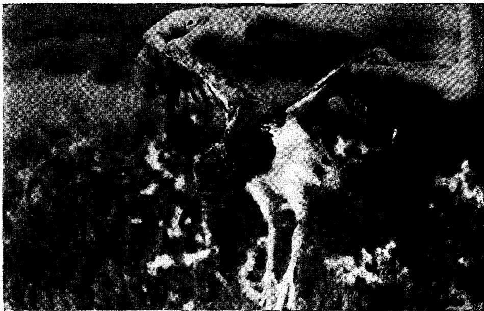
Figura 4. En el Islote Notable, ubicado en la costa S del golfo San José y frente al Laboratorio de Vida Silvestre "Isla de los Pájaros", se han llevado a cabo las tareas de anillado más intensivas que incluyó a la casi totalidad de las especies nidantes. En la foto un pichón de "ostrero común" ( Haematopus ostralegus durnfordi ) anillado.

En nuestro caso en particular, hemos trabajado con pichones de edad adecuada y con los cuidados necesarios que se deben tener en cada caso para evitar perturbaciones o mortalidad si se opera en forma apresurada y sin conocimientos eco-etológicos de las especies. En ocasiones empleamos cimbras y tramperas por nosotros diseñadas para capturar adultos, sobre todo passeriformes y tinámidos. En nuestra área de trabajo, desde el punto de vista caliológico se dan varias posibilidades para la marcación de pichones: 1) nidos sobre o entre arbustos (Géneros: Suaeda , Atriplex , Condalia ,