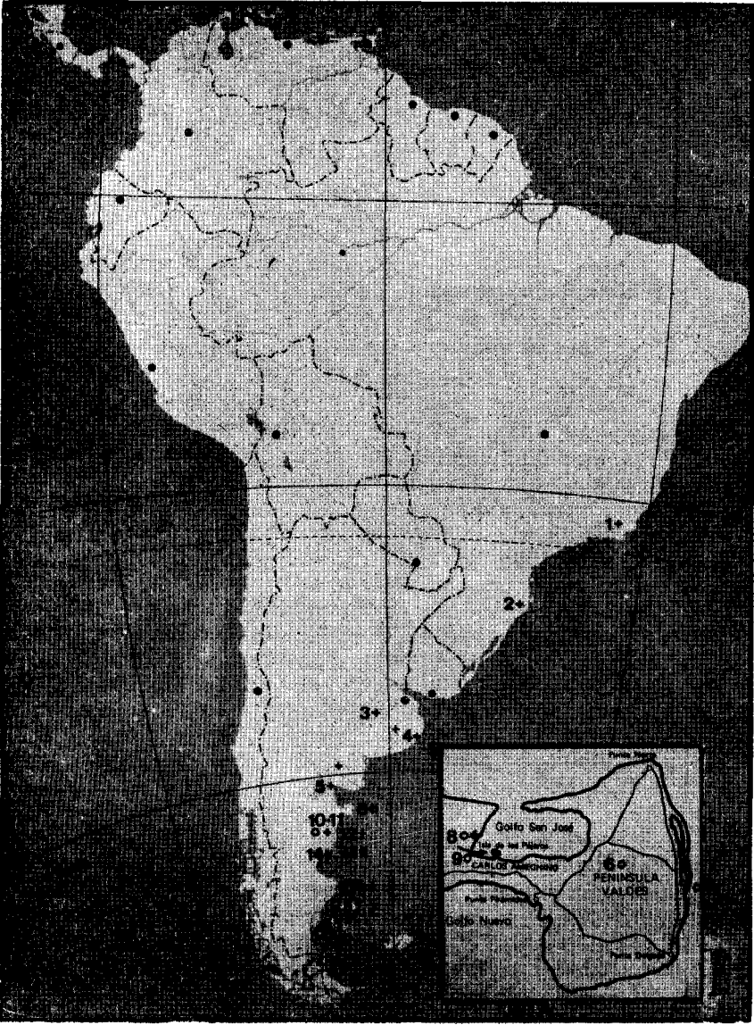
Figura 1. Plano de ubicación de las localidades donde se anilló aves (o) y se obtuvieron recuperaciones (+), mencionadas en el texto: 1, Río de Janeiro (Brasil); 2, Florianópolis (Brasil); 3, Trenque Lauquen (Buenos Aires); 4, Balcarce y Mar del Plata (Buenos Aires); 5, Guardia Mitre y San Antonio Oeste (Río Negro); 6, interior de la península Valdés (Chubut); 7, punta Cero en caleta Valdés (Chubut); 8, islote Notable = isla de los Pájaros en el golfo San José (Chubut); 9, costa S del golfo San José, entre El Riacho y punta Logaritmo en el istmo Carlos Ameghino (Chubut); 10, punta Clara (Chubut); 11, punta Tombo (Chubut); 12, Camarones y cabo Dos Bahías (Chubut); 13, isla Quintano (Chubut); 14, bahía Bustamante (Chubut) y 15, islote Estorbo = isla de los Pájaros en la ría de Deseado; 16, bahía Laura; 17, ría de Santa Cruz; 18, Cabo Vírgenes (Santa Cruz).

en relación con enfermedades virósicas de importancia agropecuaria de las que se suponía eran portadoras ciertas especies de nuestra avifauna (C. C. Olrog, 1962).