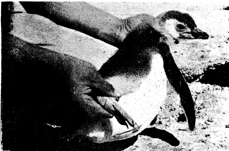
Figura 6. Un pichón de pingüino de Magallanes ( Spheniscus magellanicus ), en el momento de su marcación. Lugar: Punta Tombo, Chubut.

A pesar del escaso tiempo transcurrido, se han obtenido recuperaciones que se señalan en la figura 1.