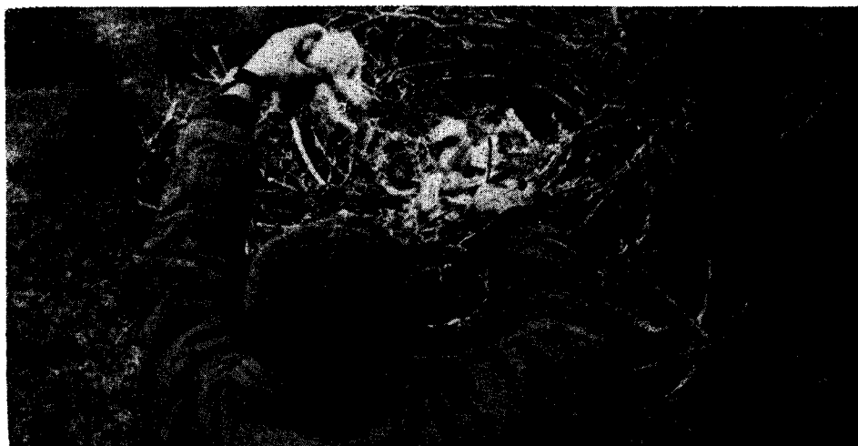
Figura 2. Para el trabajo de anillado de aves, se escoge preferentemente a los pichones, subjóvenes o jóvenes, los que son tratados con sumo cuidado. La fotografía ilustra un momento de este operativo en un nido de águila mora o de pecho blanco ( Buteo polyosoma ). Lugar: Península Valdés, entre Puerto Pirámides y Punta Norte.

La primera tarea que nos propusimos llevar a cabo en la región fue la motivación a través del periodismo local acerca de qué manera la población podía y debía contribuir a este proyecto de investigación y manejo de la vida silvestre en general y al estudio de las aves migratorias argentinas y americanas, en particular. Circunstancias fortuitas favorables a este propósito lo constituyeron la oportuna divulgación del hallazgo en la zona de dos especies de aves oceánicas que arribaron exhaustas: a) un