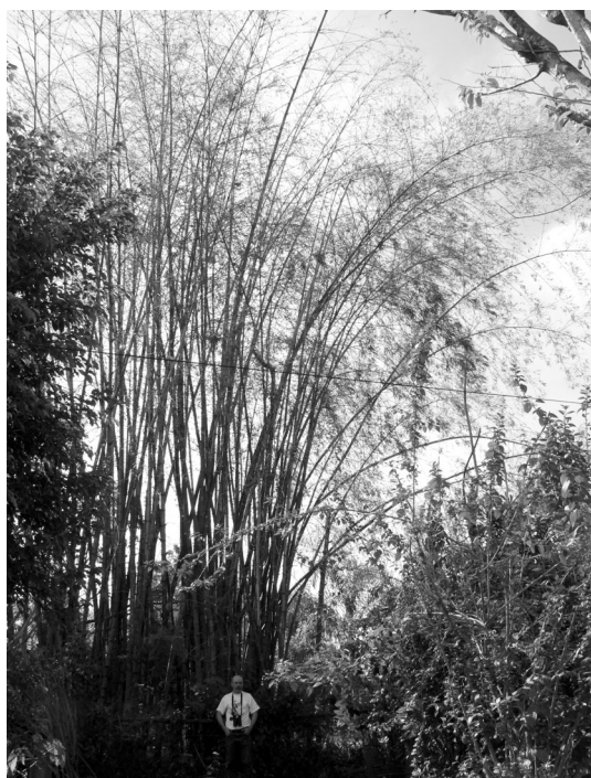
Figura 2. Parche de takuarusu ( Guadua chacoensis ) en Puerto Iguazú, Misiones, donde fue registrado el individuo de Espiguero Negro ( Tiaris fuliginosa ) que se muestra en la figura 1. Nótese la altura y la escasez de hojas de las cañas.

Individuos de los dos sexos del Espiguero Negro se alimentaban de las panojas con