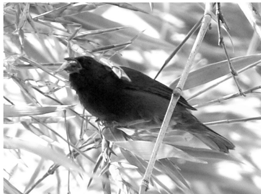
Figura 1. Macho adulto de Espiguero Negro ( Tiaris fuliginosa ) alimentándose de semillas de takuarusu ( Guadua chacoensis ), fotografiado el 13 de agosto de 2007 en Puerto Iguazú, Misiones.

Puerto Iguazú. — El 13 de agosto de 2007, a las 11:00 hs, en el jardín de una casa ubicada en Corrientes 155 de la ciudad de Puerto