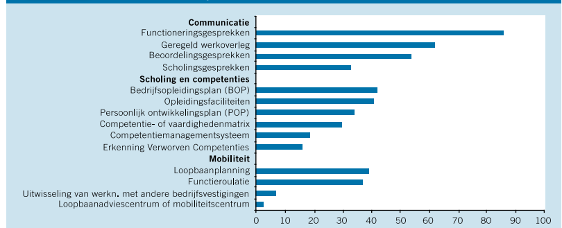
Gebruik van HR-instrumenten om de speerpunten voor de komende vijf jaar te realiseren (% bedrijven)

Bronnen voor figuren 1 t/m 4: ROA, Arbeidsmarktmonitor Metalektro, editie 2007